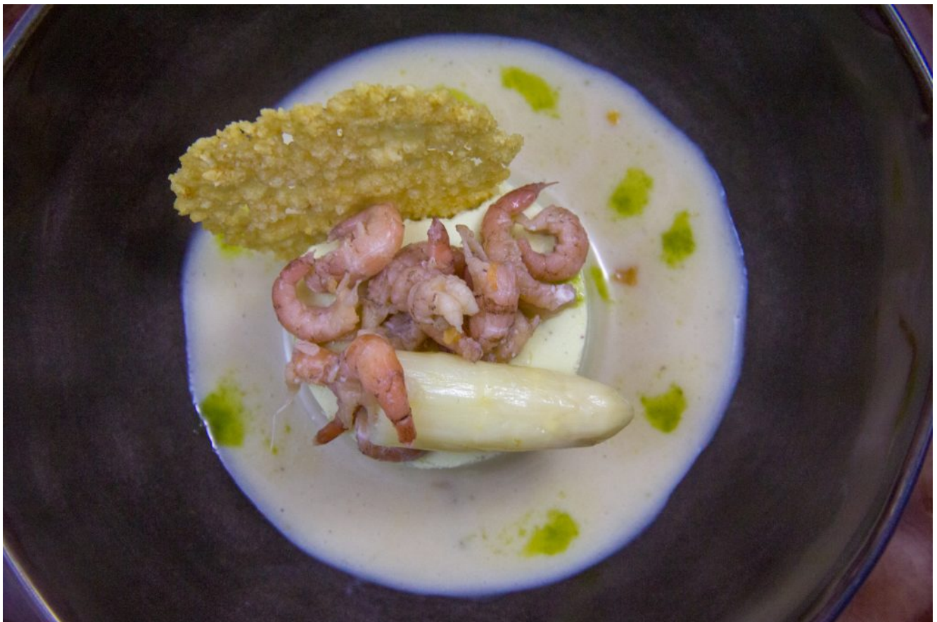
Bavarois d'asperge, crevettes grises et parmesan

L'avantage de cette recette est que vous pouvez tout préparer la veille!