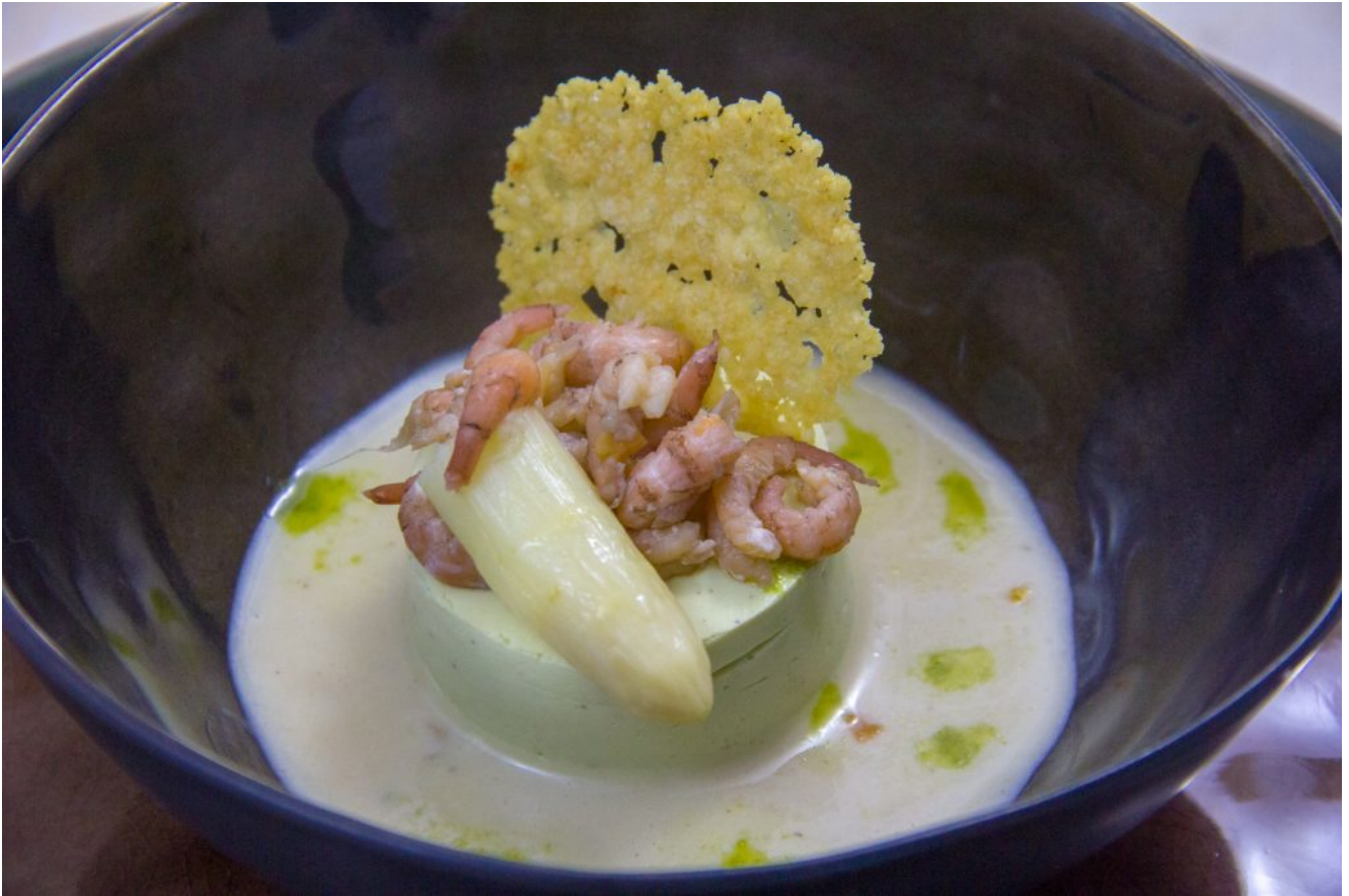
Bavarois d'asperge, crevettes grises et parmesan