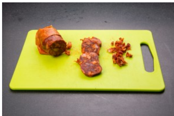
Coupez le chorizo