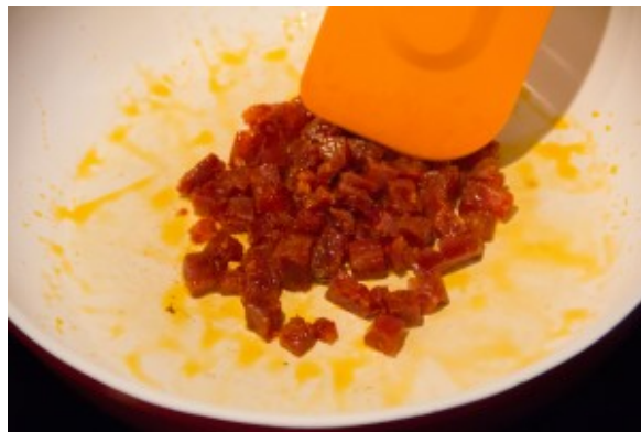
Faire revenir les dés de chorizo