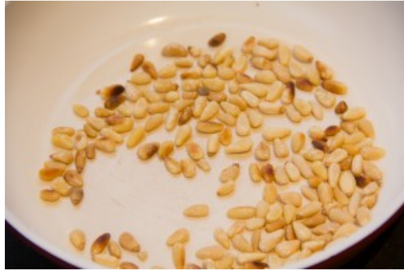
Griller les pignons à sec