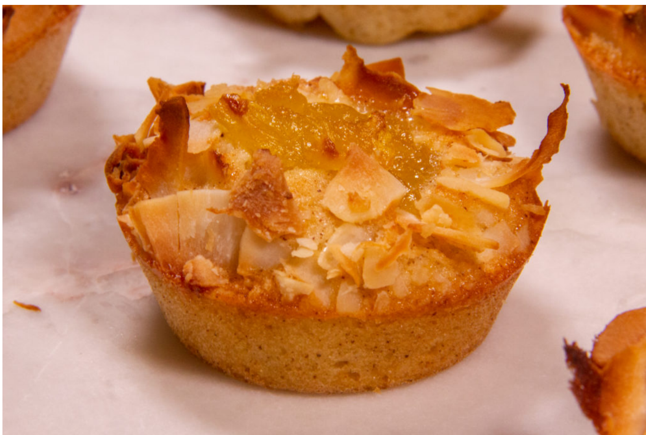
Financiers ananas confit et coco

Le financier est une pâtisserie ultra facile à réaliser en peu de temps et ne demande aucun savoir ou technique particulière. Il est moelleux et savoureux ... Vous avez envie de vous régaler? Alors vite à vos fourneaux!