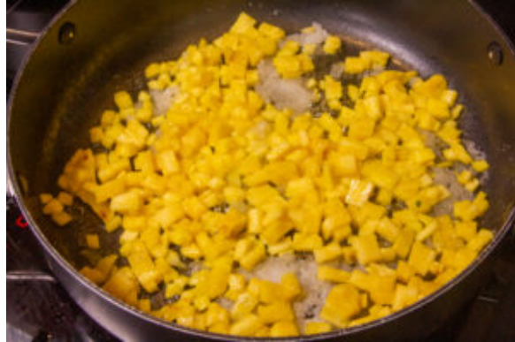
Laissez caraméliser l'ananas