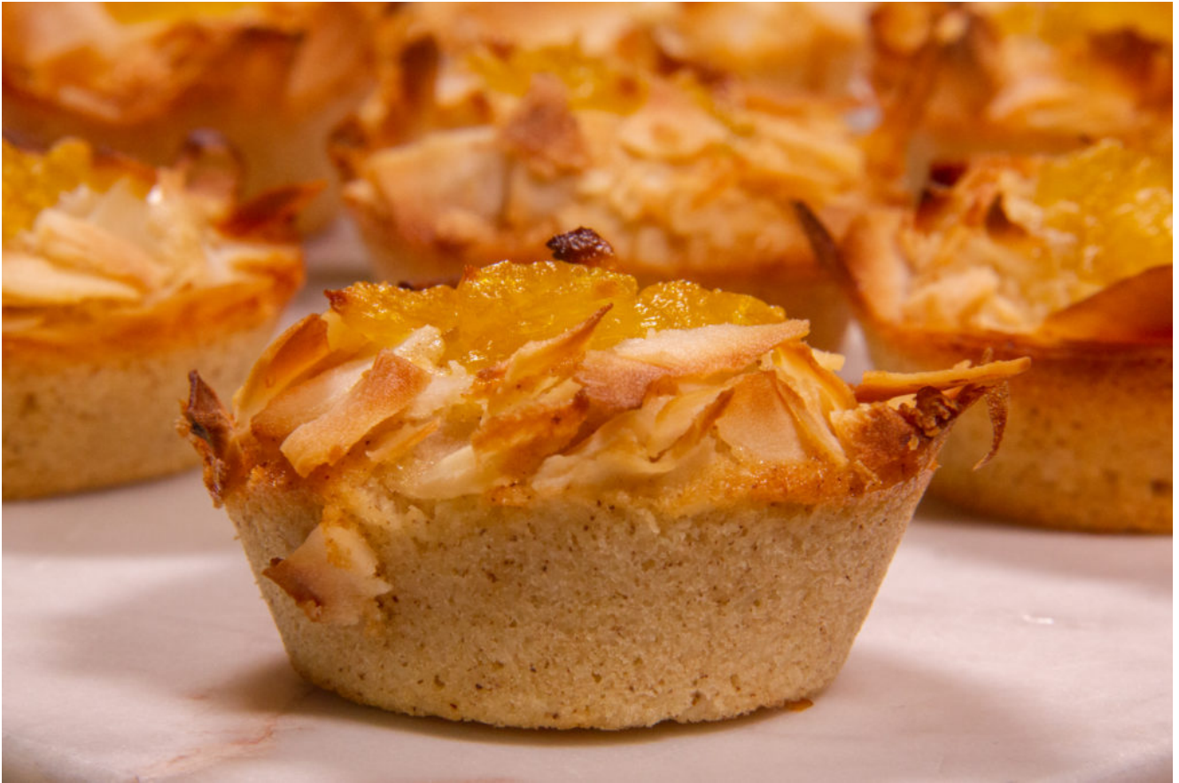
Financiers ananas confit et coco