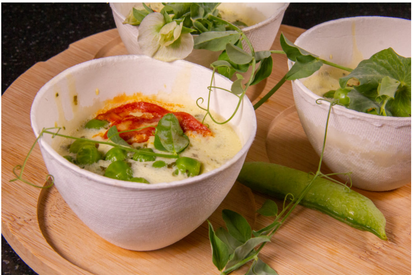
Flans petits pois menthe (recette Thermomix)

Ces petits flans salés cuits vapeur dans des petits bols à thé sont très faciles et rapides à faire. On peut y ajouter selon les goûts des champignons, du poulet, des crevettes, des morceaux de poisson, de l'anguille fumée...C'est une recette idéale à réaliser avec votre Thermomix!