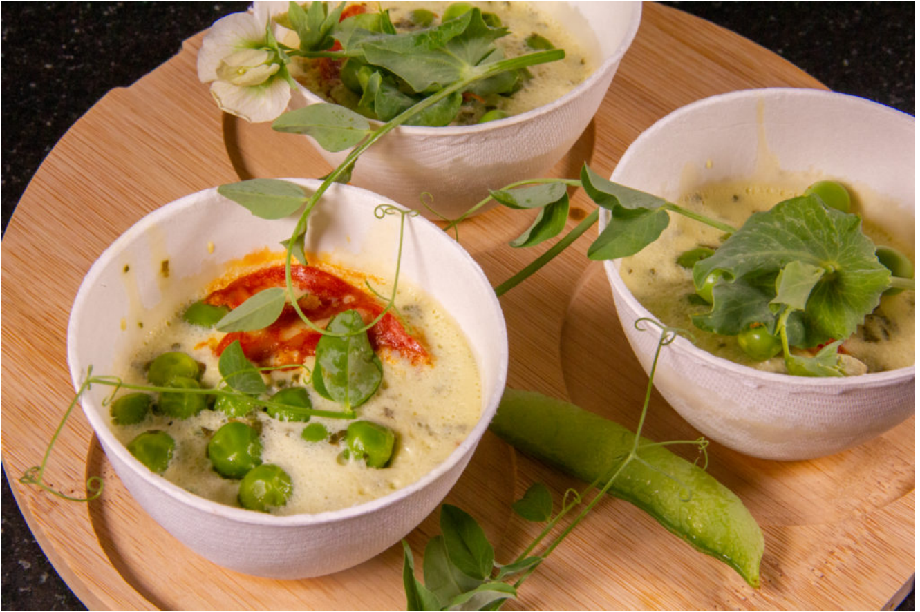
Flans petits pois menthe (recette Thermomix)