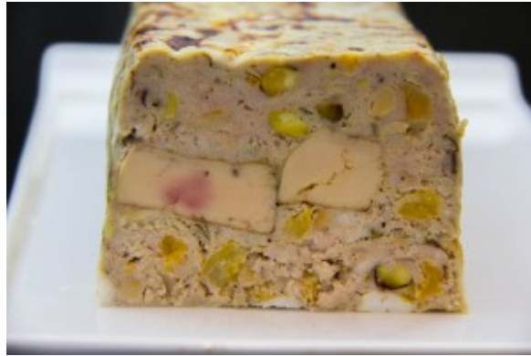
Terrine de porc et foie gras, pistaches et abricots

Foie gras laqué à la betterave, sauce au raifort. Pour la recette cliquez ici