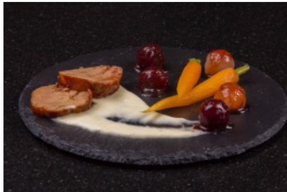
Foie gras laqué à la betterave, sauce raifort

Foie gras laqué à la betterave, sauce au raifort. Pour la recette cliquez ici