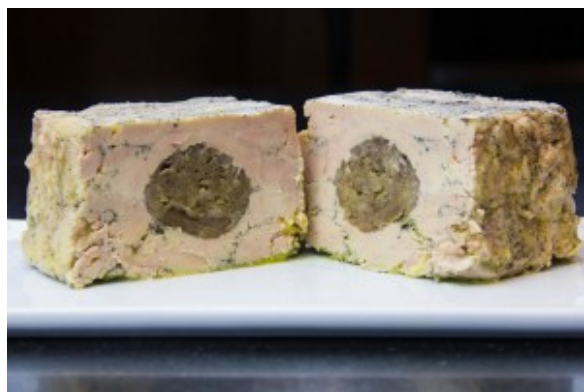
Terrine de foie gras maison aux marrons et cognac

Terrine de foie gras aux marrons et au cognac. Pour la recette cliquez ici