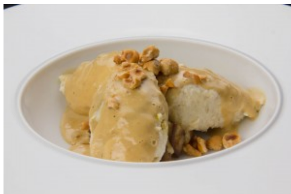
Quenelles de volaille au

Quenelles de volaille au foie gras, poêlée de fruits d'hiver. Pour la recette cliquez ici