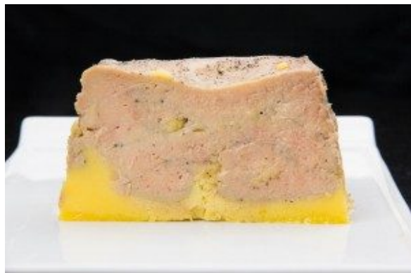
Terrine de foie gras maison basse température

La plus classique: Terrine de foie gras maison basse température au four. Pour la recette cliquez ici