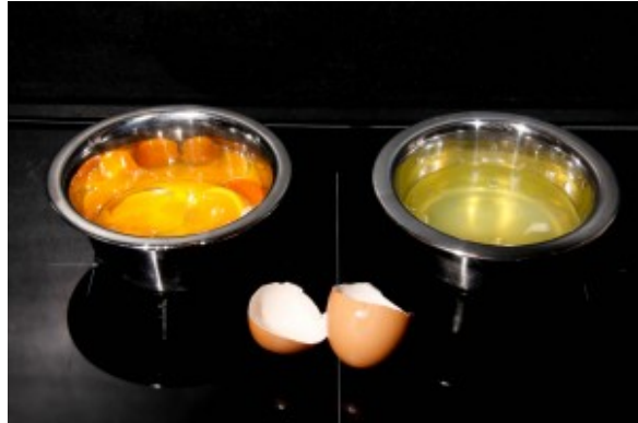
Clarifiez les oeufs