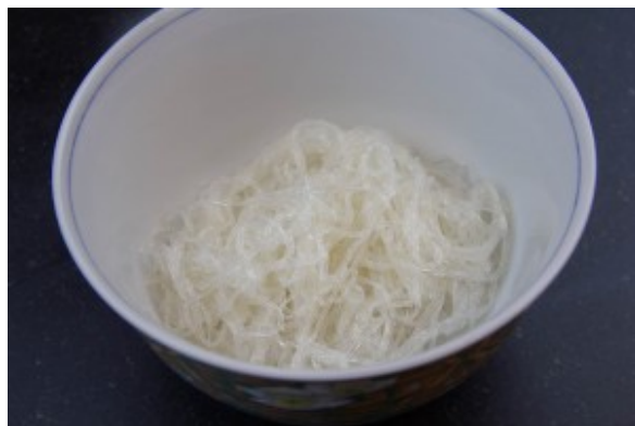
Dressez des nouilles au fond du bol individuel