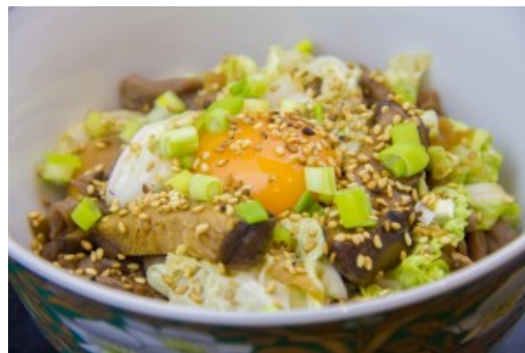
Mon Sukiyaki revisité ( fondue japonaise au bœuf, nouille et légumes)

Je vous le propose ici revisité en plats individuels. C'est un plat qui remporte toujours énormément de succès à la maison! Pour vous procurer les ingrédients japonais qui vous manquent voici l'adresse d'un site de vente en ligne: Kioko ( seulement en France).