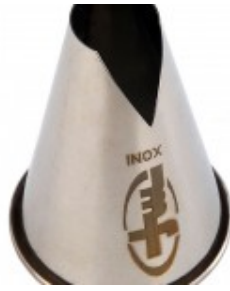
douille saint- honore