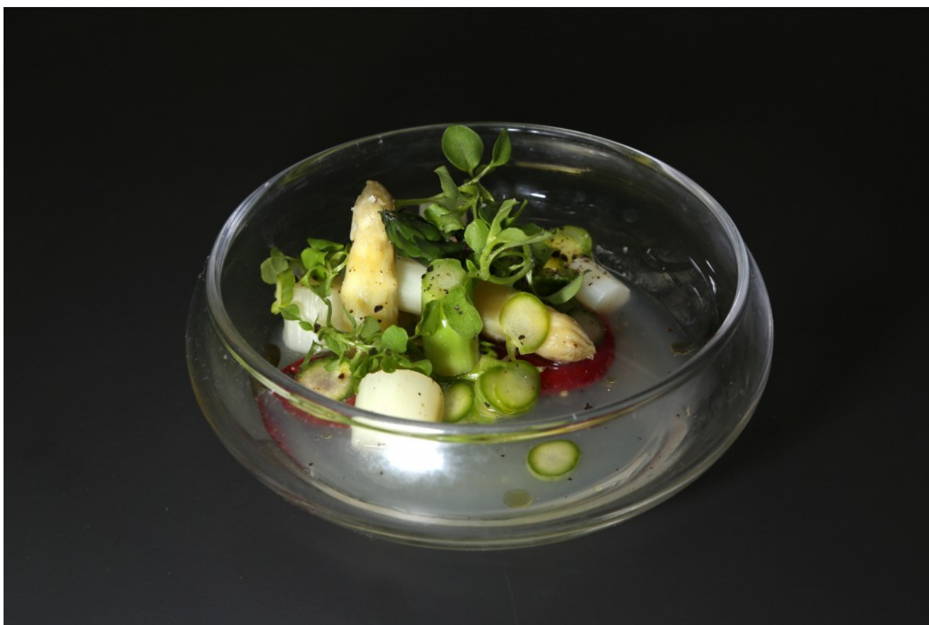
Asperges vertes, blanches et fraises