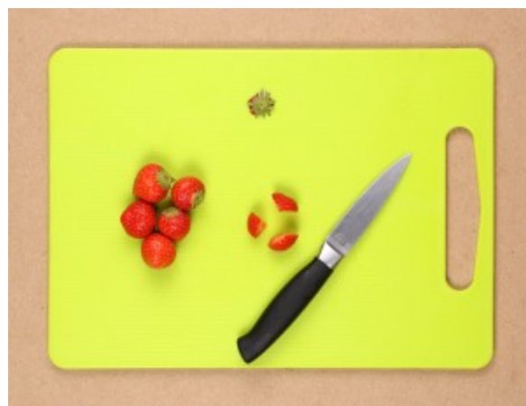
fraises coupées en trois