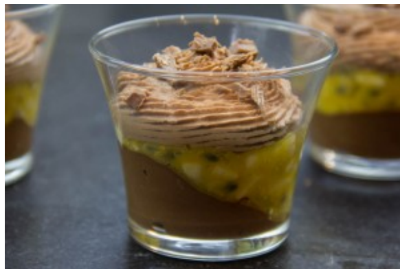
Chok'Banane de Christophe Michalak

Une idée de dessert pour Pâques? Et bien sûr au chocolat! Voici une recette du très talentueux Christophe Michalak qui nous propose une verrine aux deux chocolats rafraîchie par une salade de fruits exotiques. Un pur plaisir comme toutes ses réalisations!