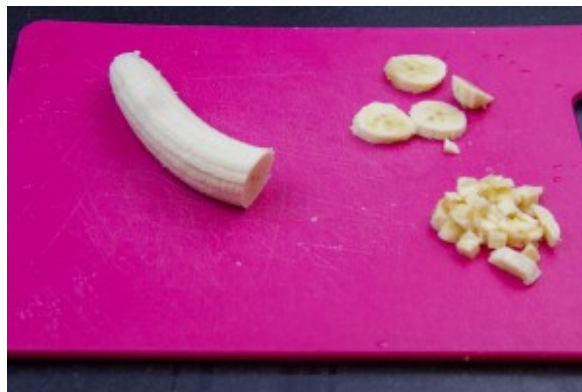
Coupez la banane en petits dés