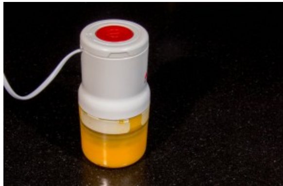
Mixez la mangue