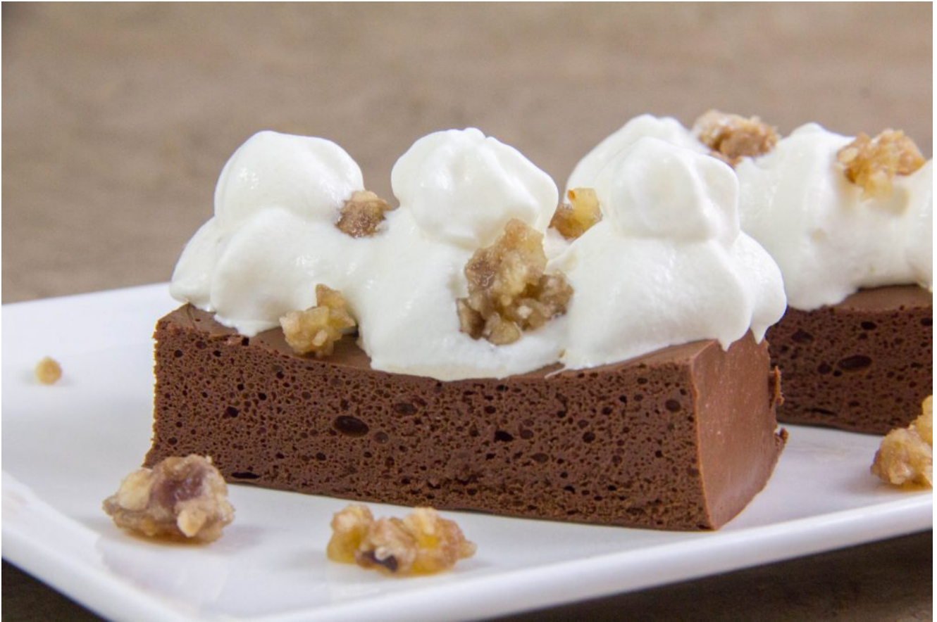
Gâteau aérien au chocolat sans cuisson de Thierry Marx