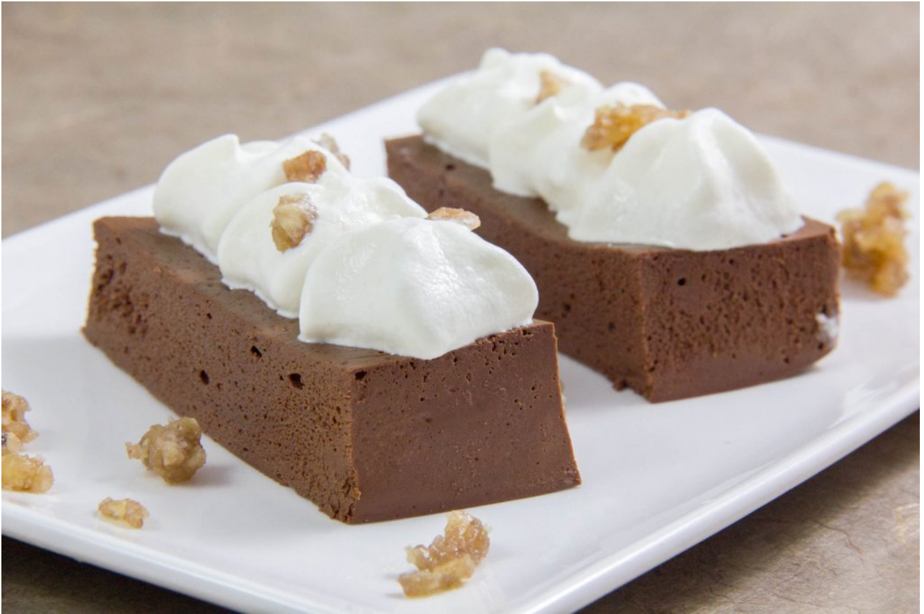
Gâteau aérien au chocolat sans cuisson de Thierry Marx