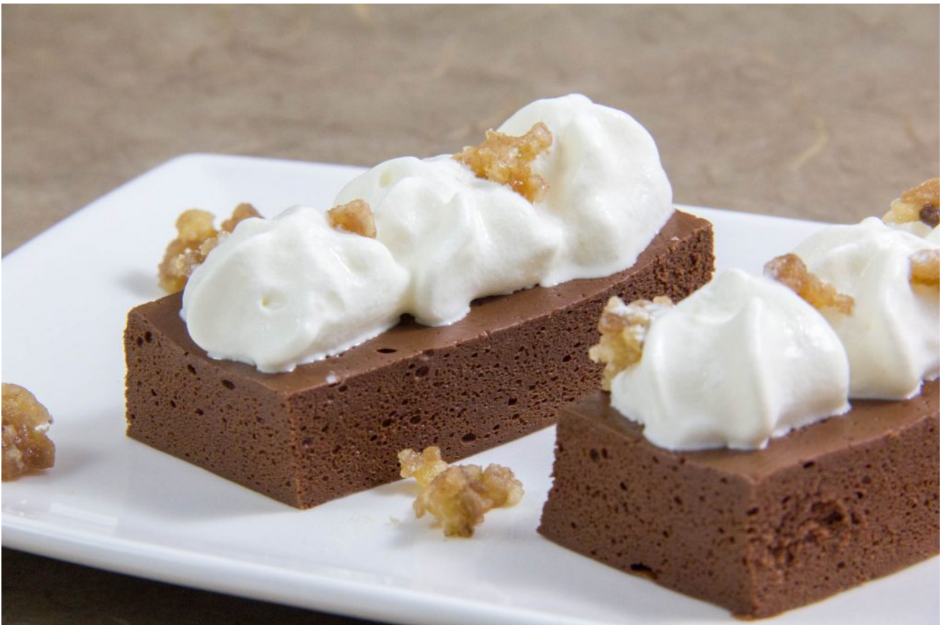
Gâteau aérien au chocolat sans cuisson de Thierry Marx