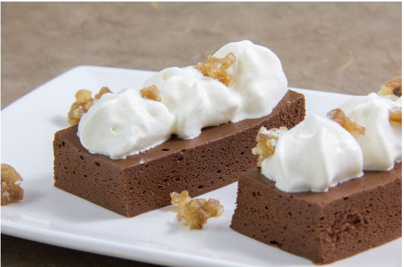
Gâteau aérien au chocolat sans cuisson de Thierry Marx