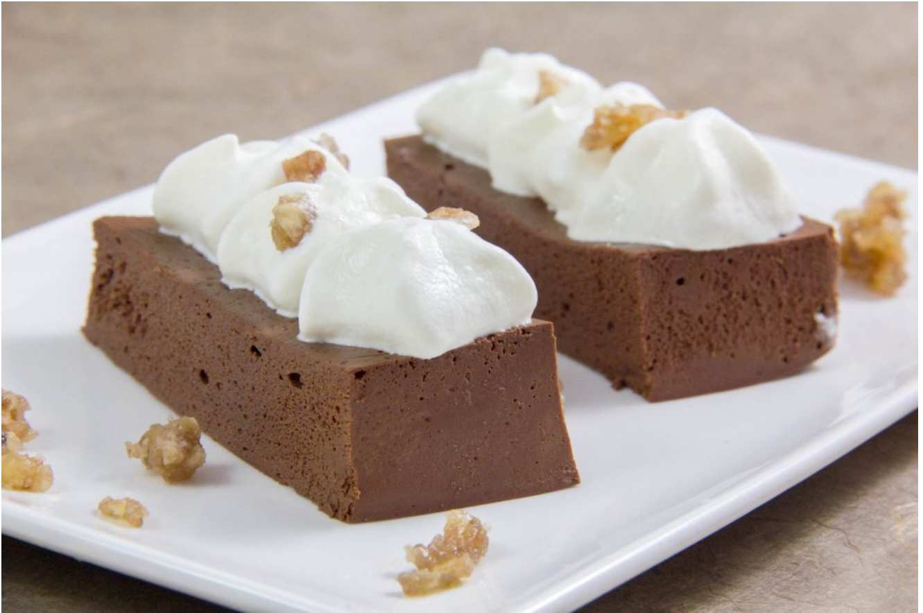
Gâteau aérien au chocolat sans cuisson de Thierry Marx