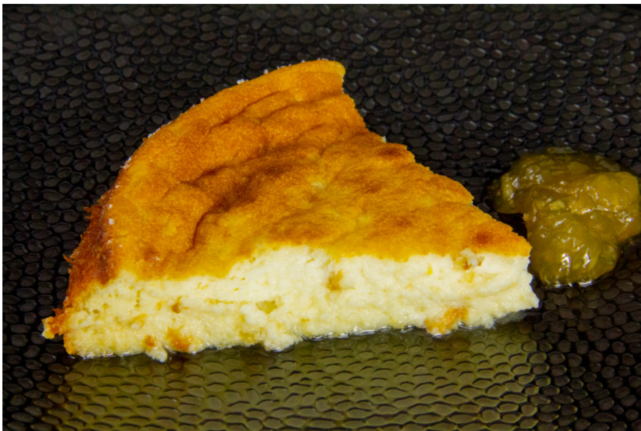
Fiadone de mon amie Corinne