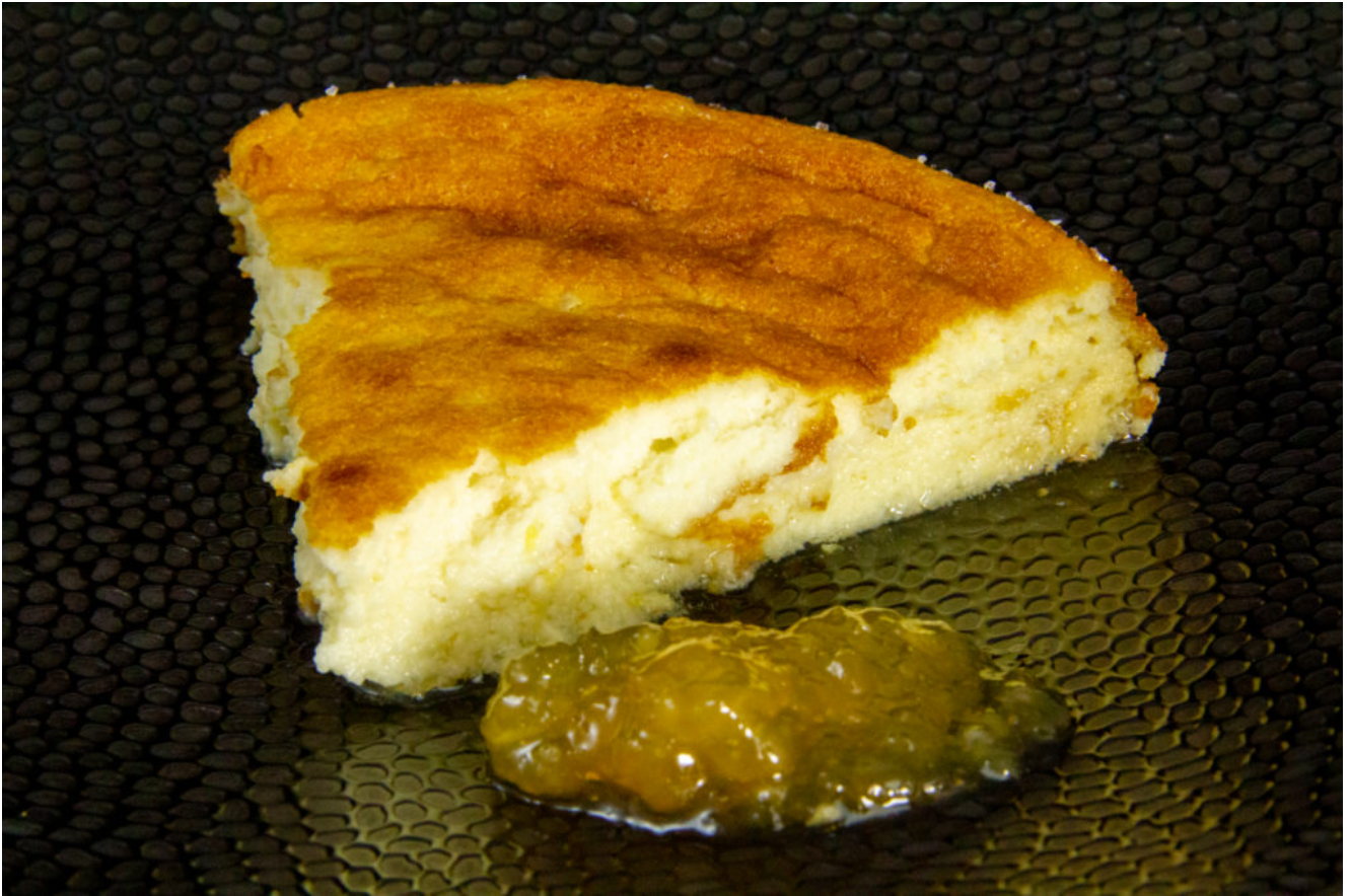
Fiadone de mon amie Corinne