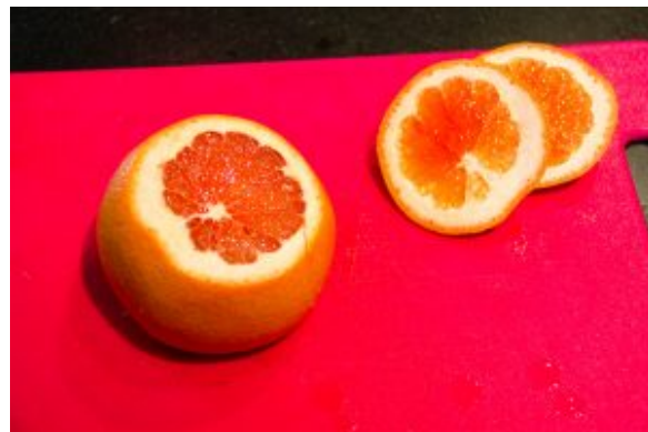
Coupez les deux extrémités du pampleousse