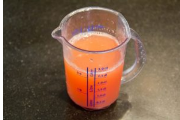
Pampleousse et sirop de gingembre