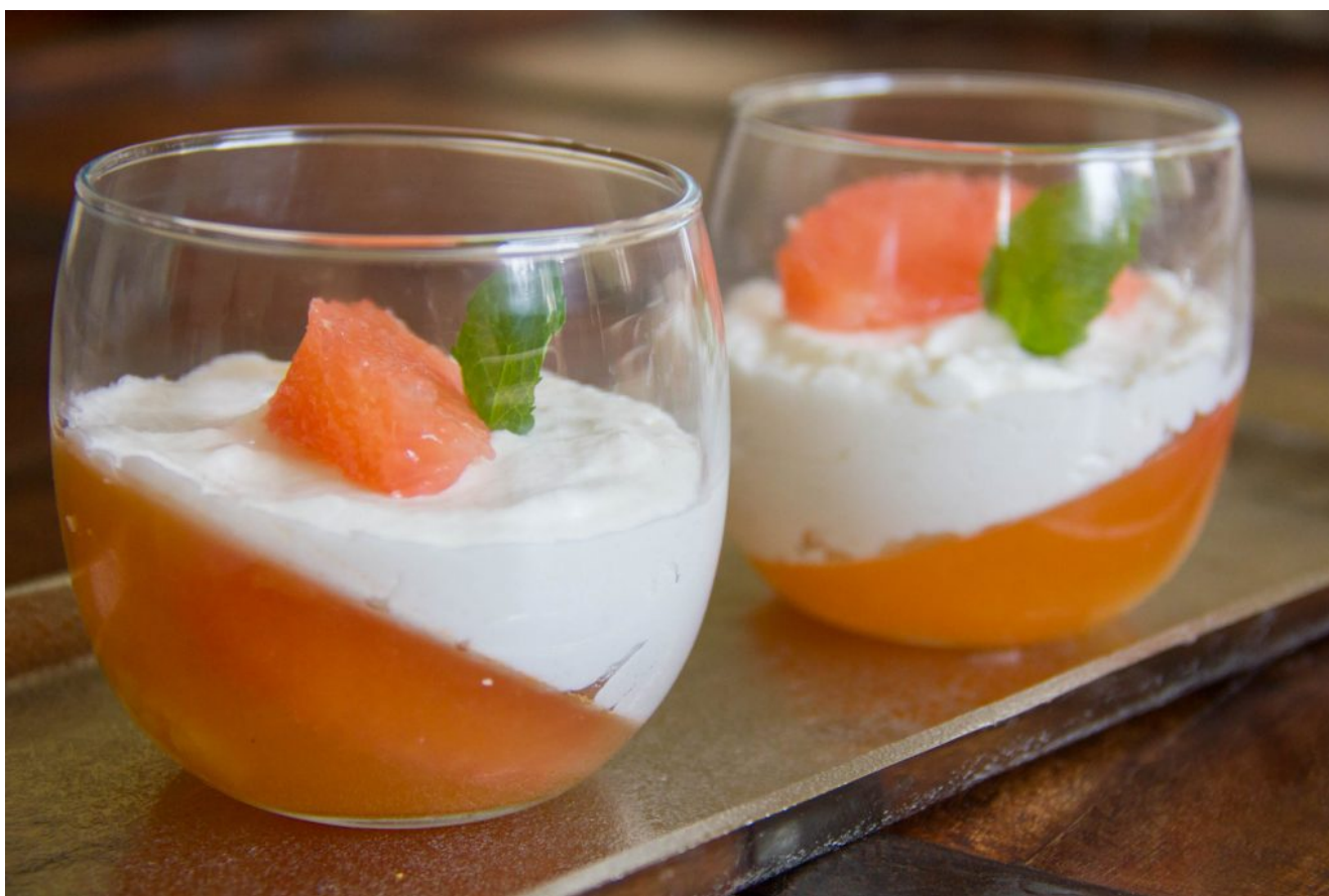
Gelée de pamplemousse au gingembre et sa mousse coco

Si vous aimez la noix de coco et les saveurs exotiques, ce dessert est fait pour vous! Voici mes petites verrines rafraîchissantes et gourmandes que vous dégusterez avec délice: gelée de pamplemousse au gingembre et sa mousse coco.