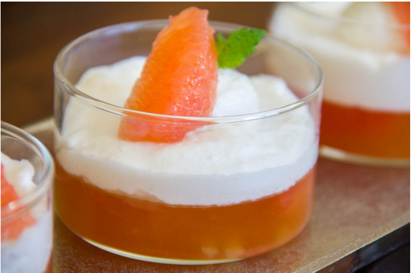
Gelée de pampleousse au gingembre et sa mousse coco