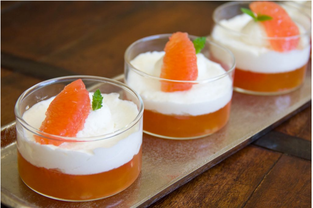
Gelée de pampleousse au gingembre et sa mousse coco