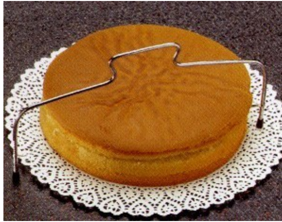
Découpe de la génoise en cercle