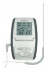
thermomètre sonde-de- cuisson