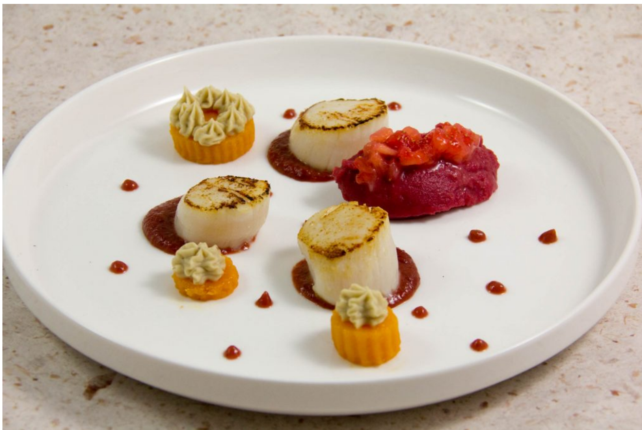
Saint Jacques en habit rose, petits légumes d'hiver

Aujourd'hui voici une recette qui m'a été inspirée par un plat de Saint Jacques, châtaigne et courge confite servi dans le restaurant du chef Georges Blanc. Je dis bien inspirée car si la présentation s'en rapproche grandement, la réalisation en est différente car je ne connais pas les secrets de sa recette... Celles du chef étaient un vrai régal mais je dois dire que mon interprétation de Saint Jacques en habit rose, petits légumes d'hiver a remporté un vif succès à la maison. La fraise se marie intimement avec la betterave et réveille avec brio la douceur des Saint Jacques. Alors régalez-vous!