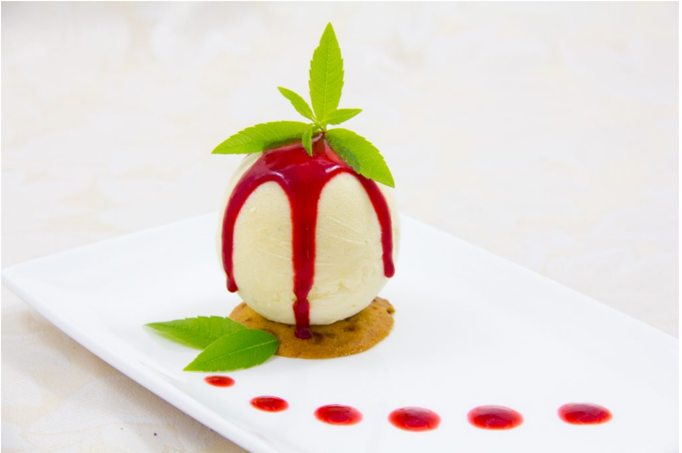
Glace fraîcheur à la verveine et citron vert