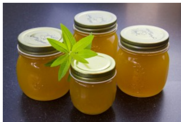
Gelée de citron à la verveine