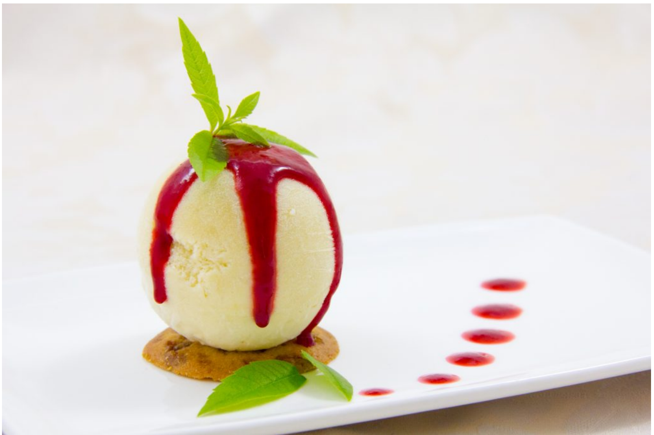
Glace fraîcheur à la verveine et citron vert