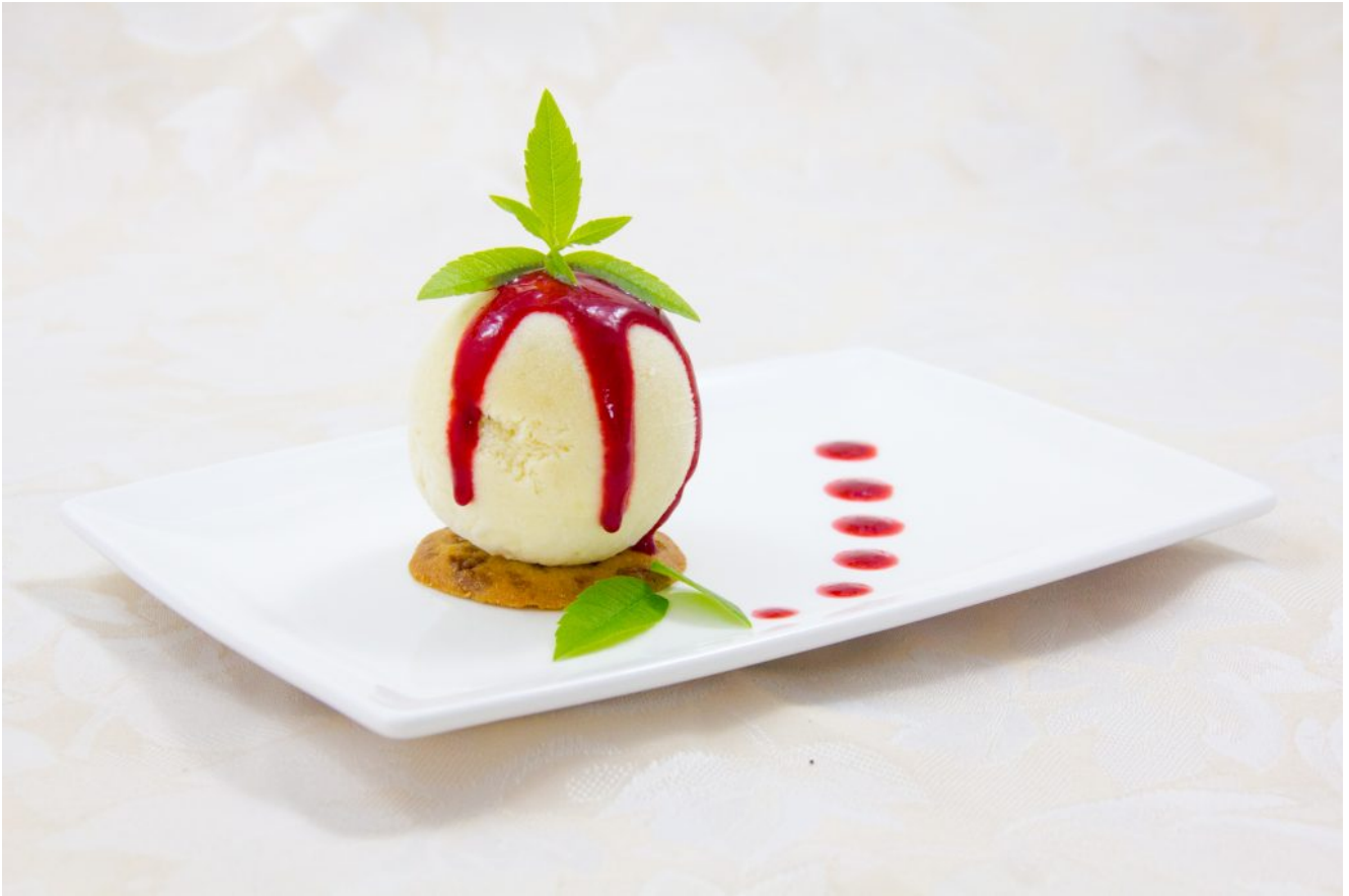
Glace fraîcheur à la verveine et citron vert