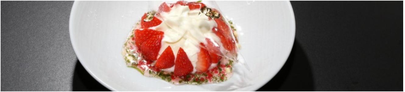
dessert aux fraises de Naoëlle d'Hainaut