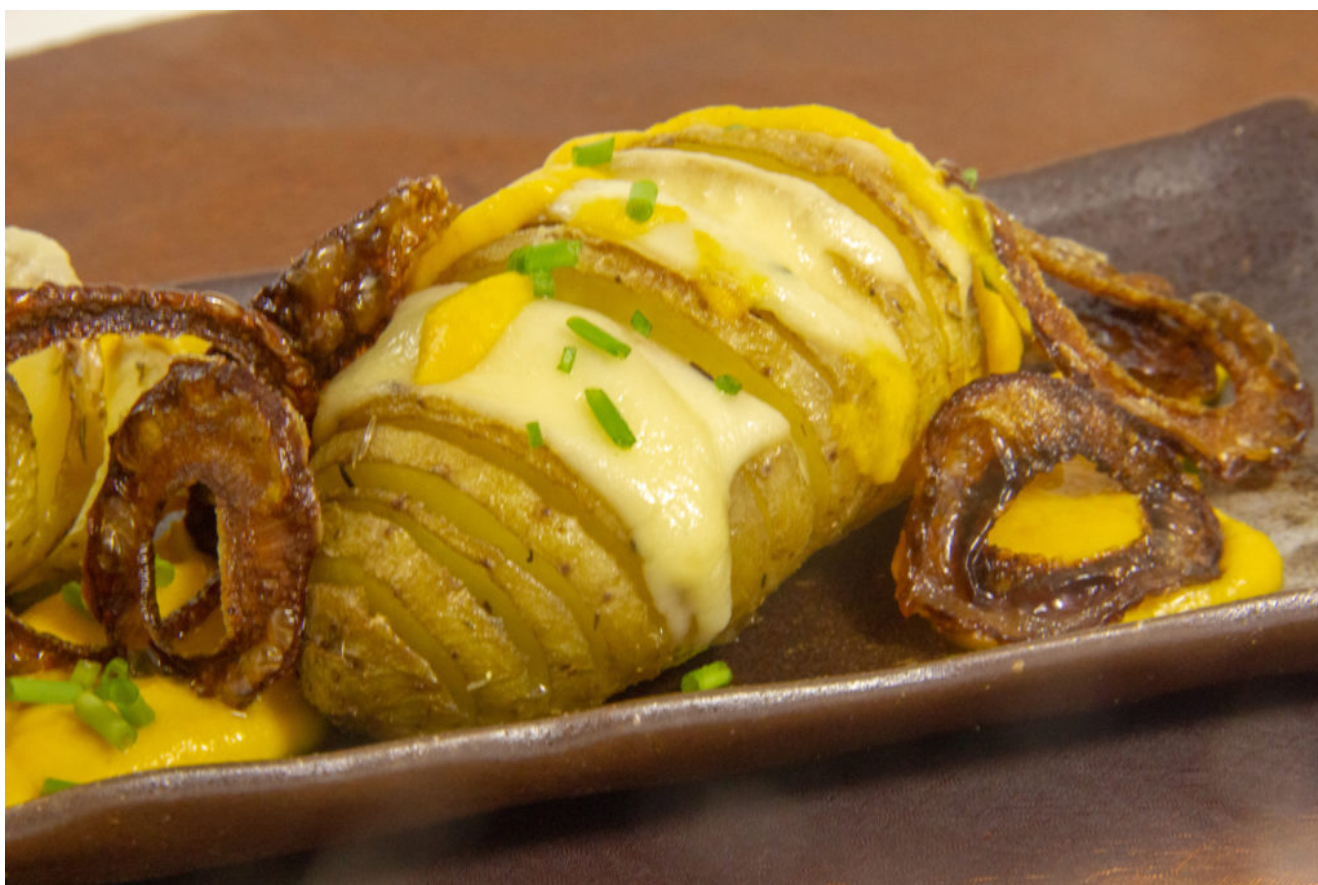
Pommes éventail, gouda, oignons frits et sauce carotte

Un bon petit plat revigorant et gourmand à servir avec une salade agrémentée avec des noix pour une douce soirée d'hiver... Voici mes Pommes éventail, gouda, oignons frits et sauce carotte, un plat végétarien qui va vous régaler.