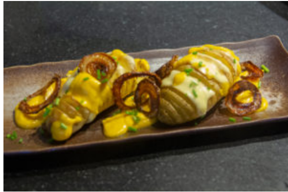
Pommes éventail, gouda, oignons frits et sauce carotte