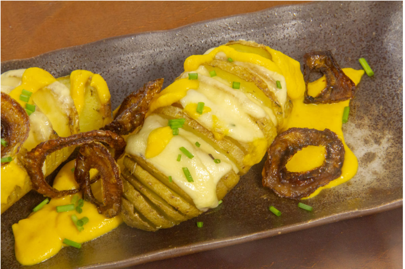
Pommes éventail, gouda, oignons frits et sauce carotte