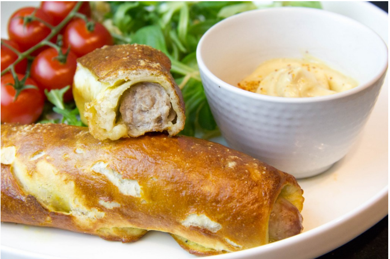
Mes Hotdogs maison

Rien de meilleur que ces hotdogs maison qui n'ont rien à voir à ceux caoutchouteux que vous achetez dans les foires ou au super marché. La recette est facile. Essayez les : vous ne verrez plus jamais les hotdogs de la même manière et vos ados vont vous adorer!