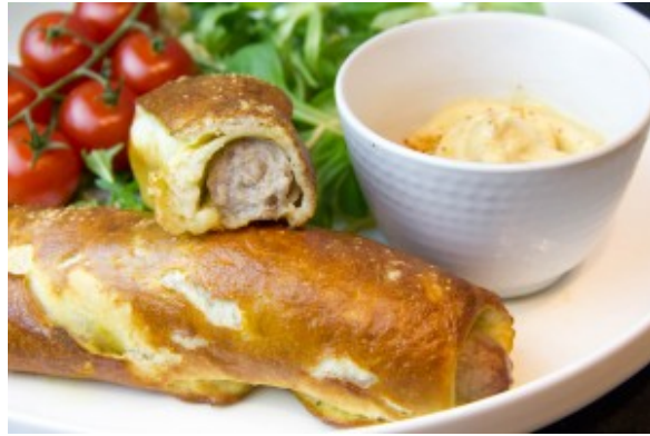
Mes Hot dogs maison