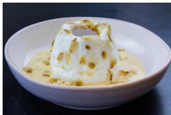
Île flottante, amande grillées et caramel beurre