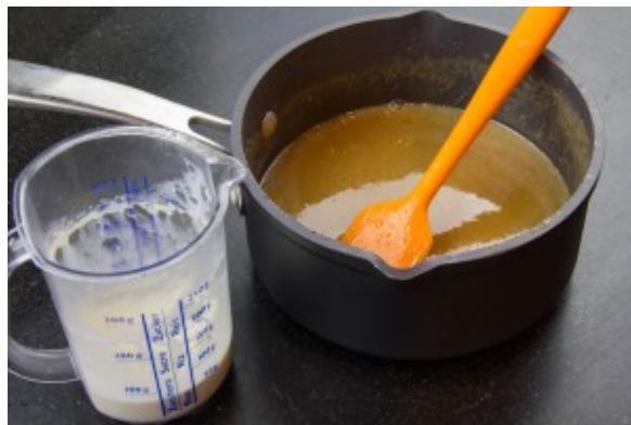
Ajoutez la crème tiède