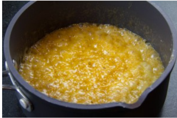
Le caramel mousse