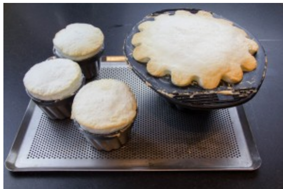
A la sortie du four...