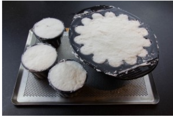
Remplir les moules