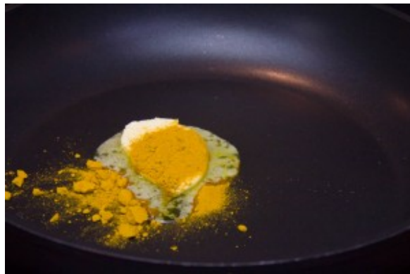
Faire revenir un peu de beurre avec une belle cuillerée à soupe de cumin.