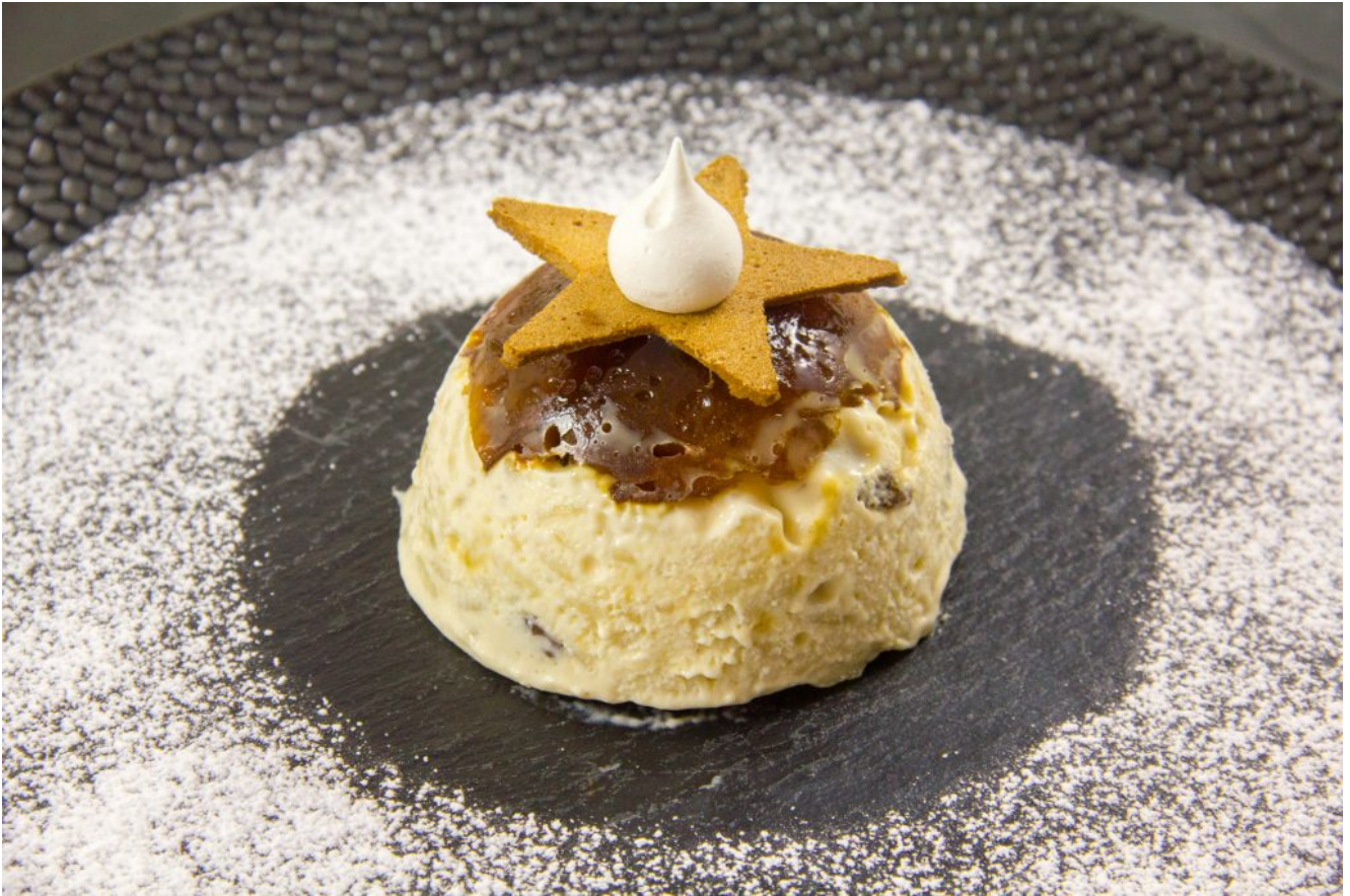
La pomme au riz (inspirée de la recette de Mercotte, Le meilleur Pâtissier 2017)