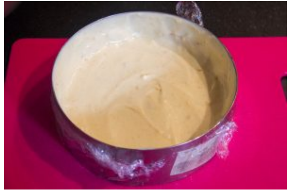
Garnir de crème diplomate