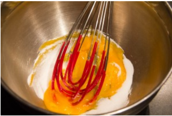
Fouettez les jaunes et le sucre