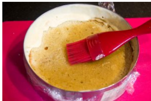
Posez un premier cercle de génoise sur le fond et