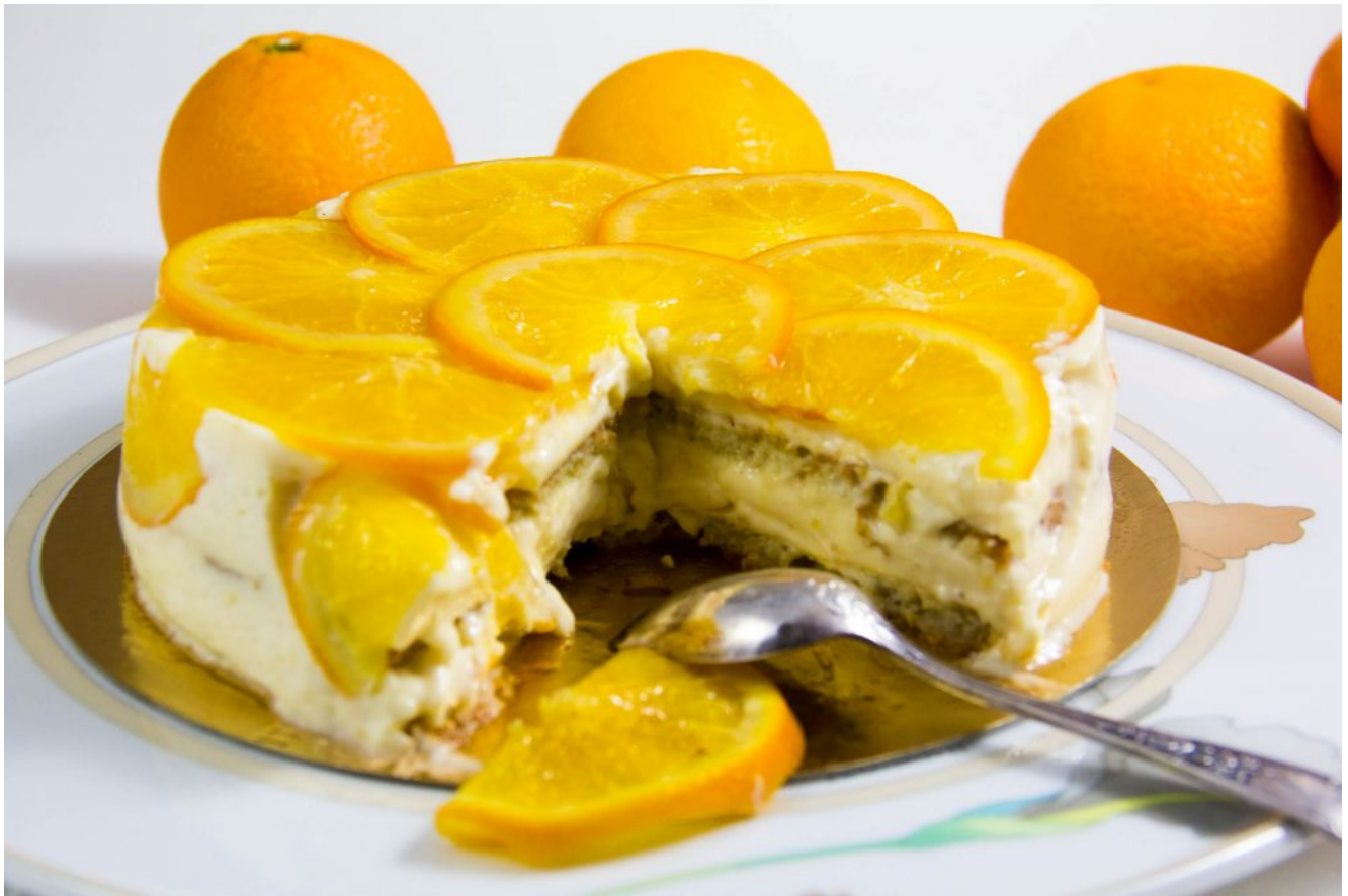
La rosace de la grande cocotte ou rosace à l'orange