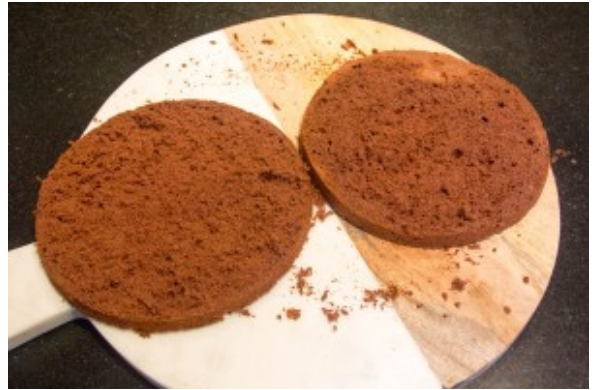
Les deux parts de la génoise