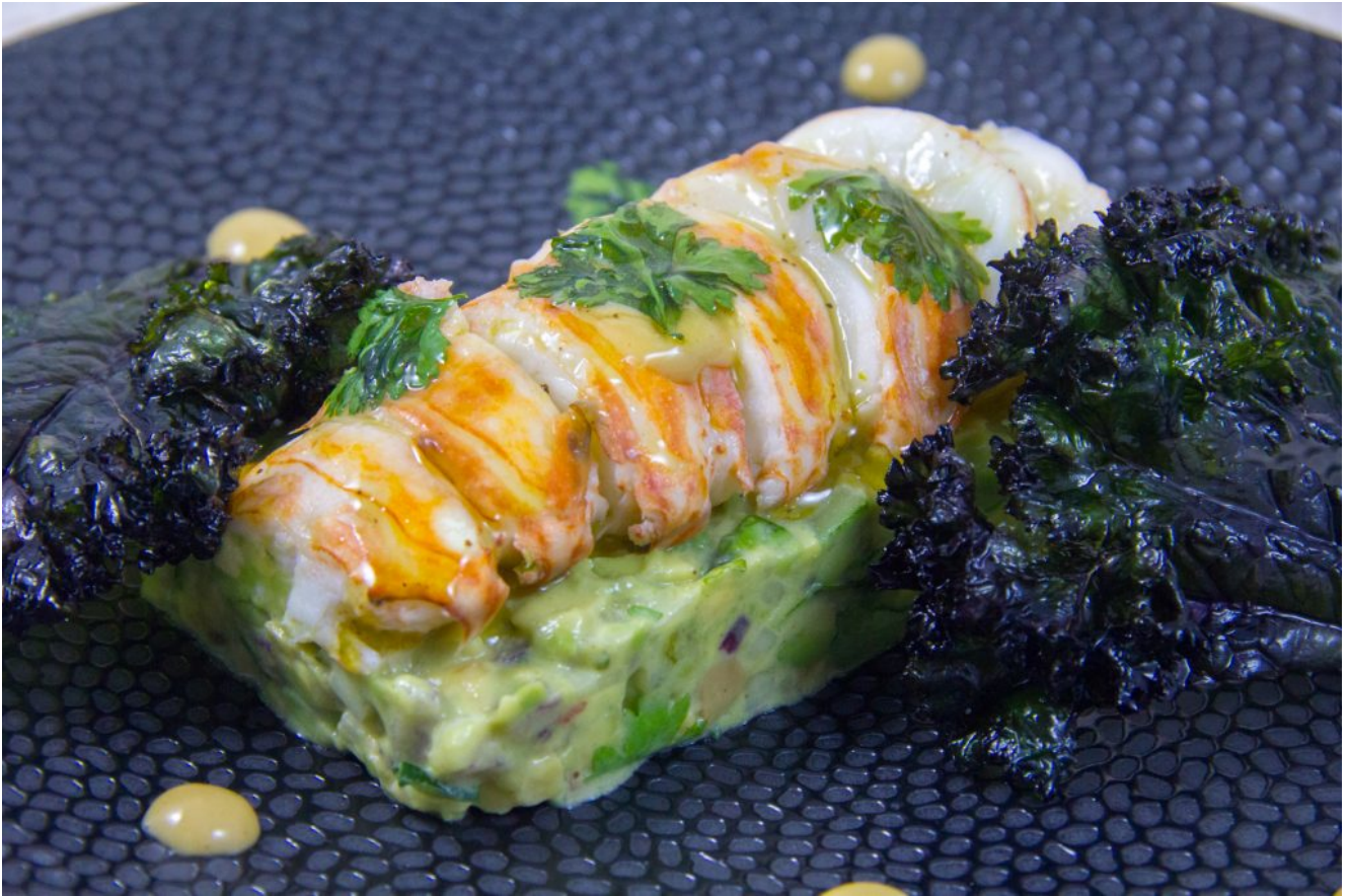
Queue de langouste basse température et son tartare d'avocat, courgette, coriandre