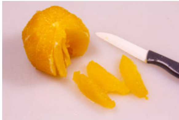
Prélevez les suprêmes d'orange