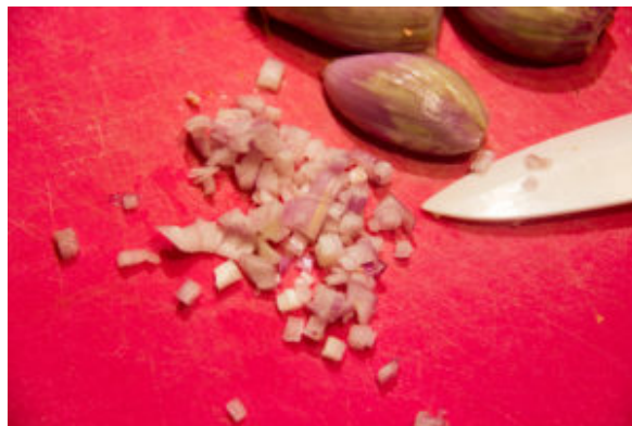
Ciselez finement échalote et oignon