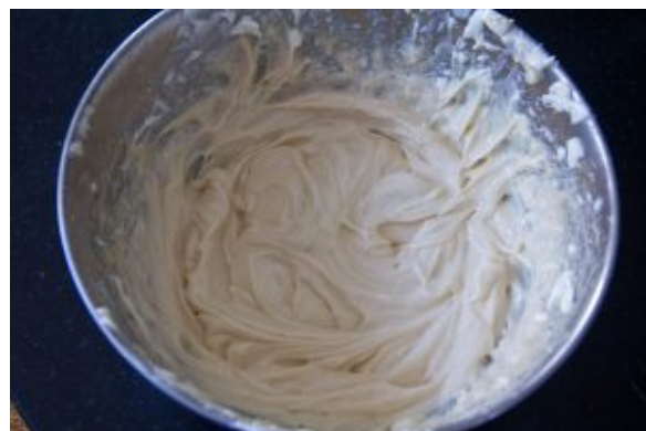
Travaillez le bien fromage à