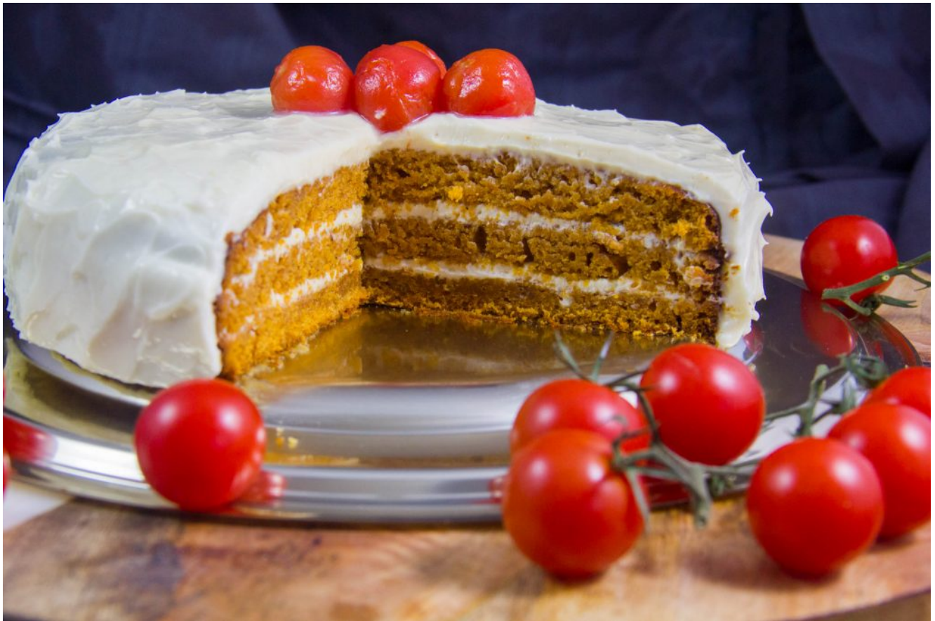
Le Bloody Cake de Mercotte ou Tomato soup cake

Et retrouvez les meilleures recettes de Mercotte tirées de son fameux grimoire. Pour acquérir cet ouvrage cliquez sur la photo ci-dessous: