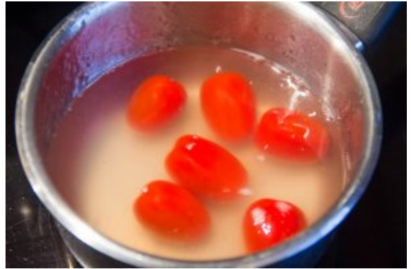
Pochez les tomates