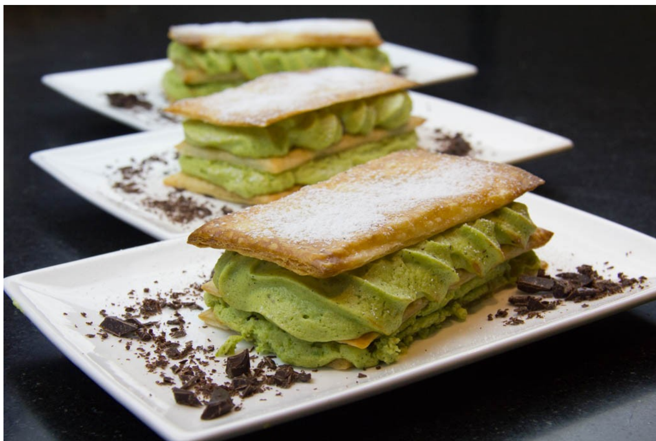
Mille feuille soufflé à l'avocat et chocolat

A l'origine la recette du chef est un soufflé sucré à base d'avocat avec un cœur coulant au chocolat. J'ai associé cette base à l'avocat à une pâte feuilletée pour y ajouter du croustillant et un visuel encore plus gourmand. C'est une recette rapide, facile, gourmande qui étonnera vos convives.