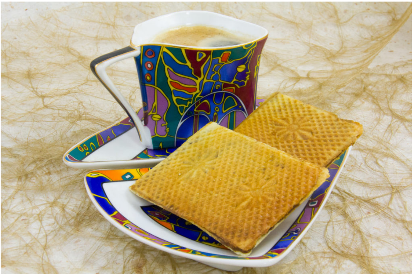
Gaufres du Ch'nord