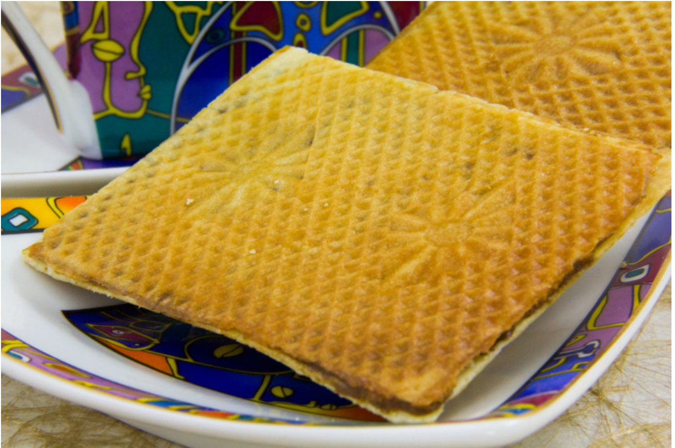
Gaufres du Ch'nord