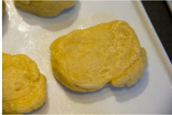
Aplatissez chaque boulette