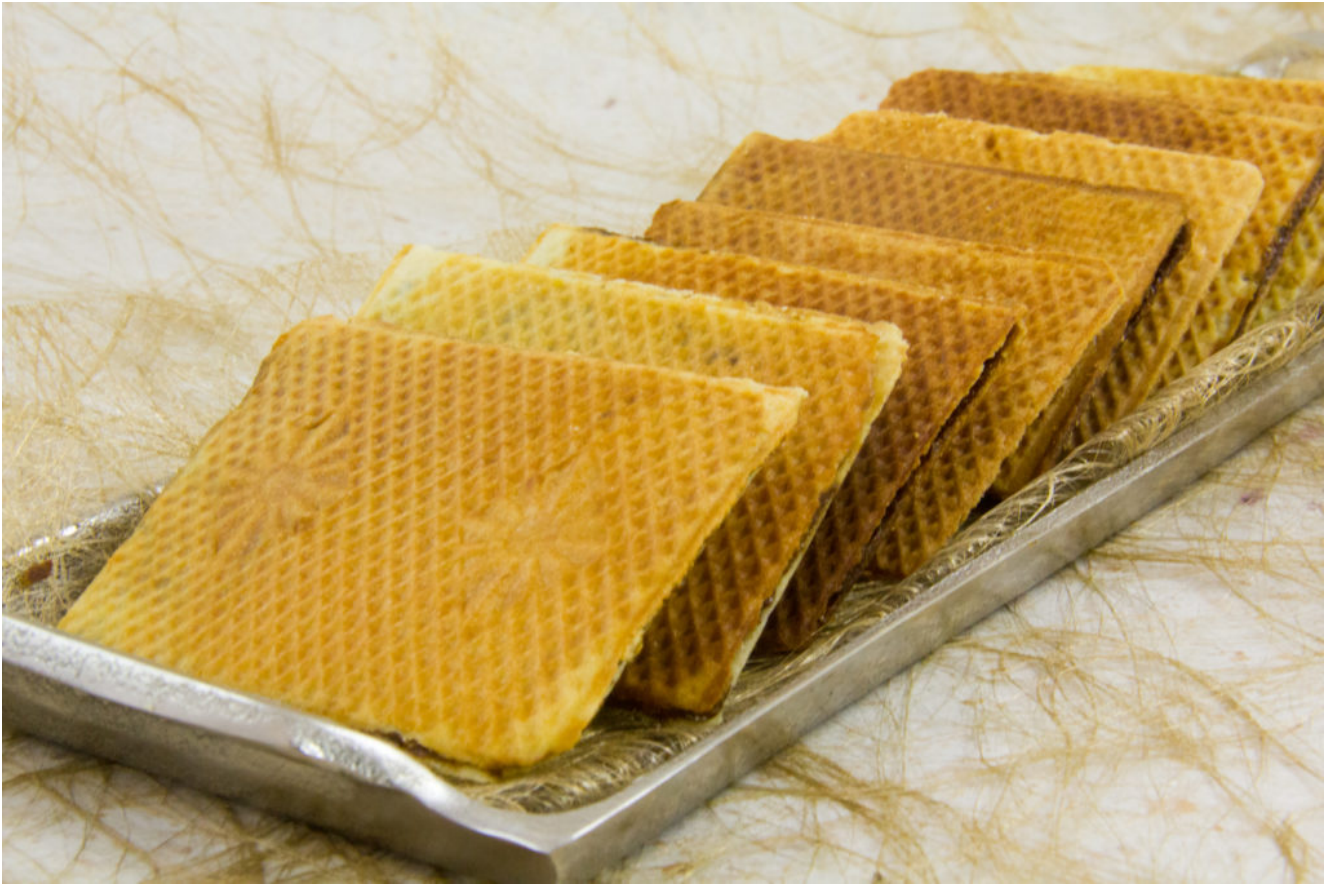
Gaufres du Ch'nord