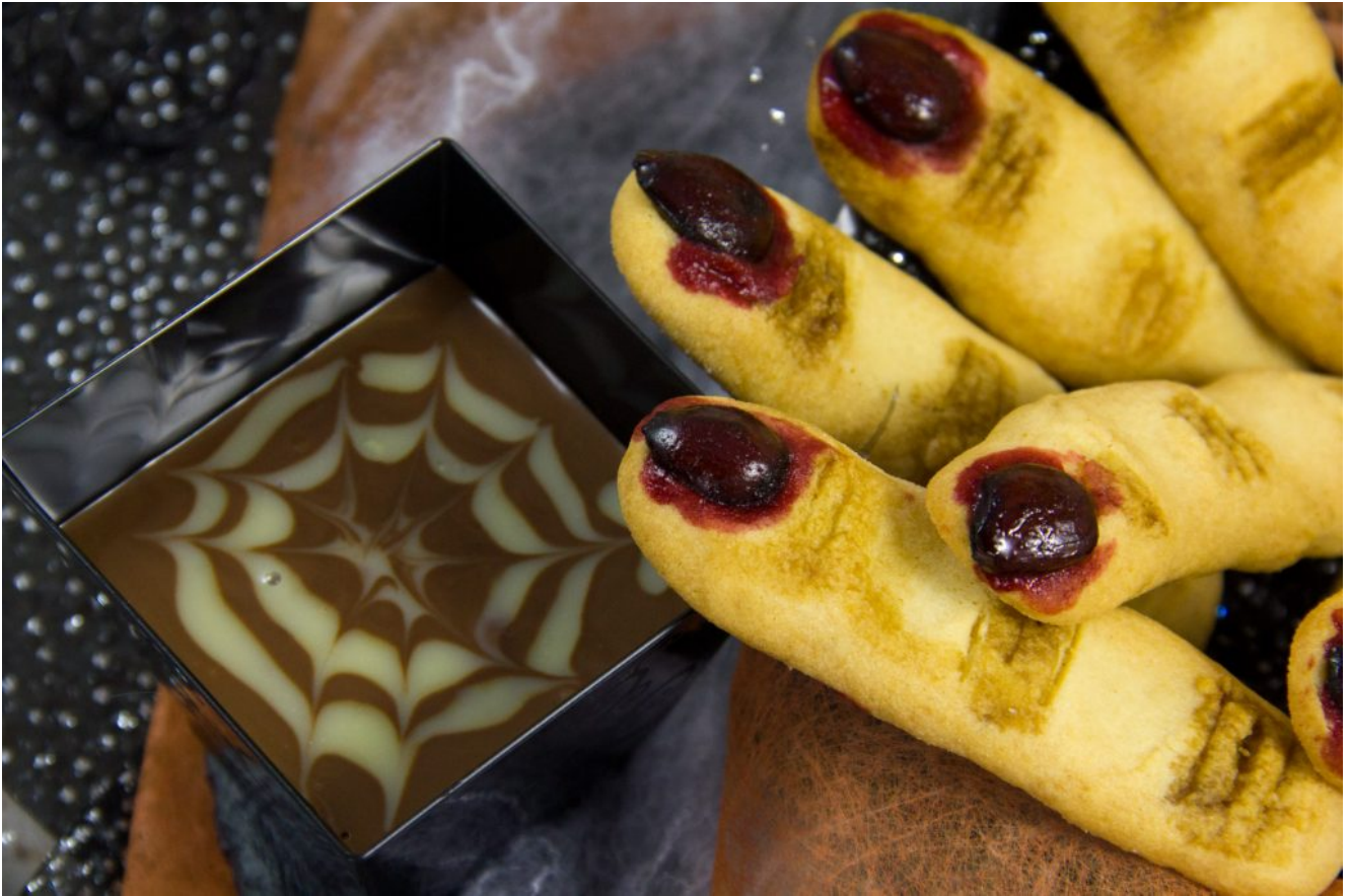
Los dedos de bruja (ou doigts de sorcière, épreuve de Mercotte « Le meilleur Pâtissier 2017 »)