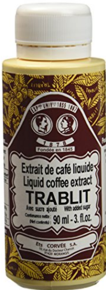
TRABLIT Extrait de Café Liquide 90 ml