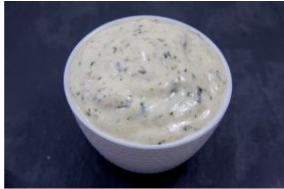
Béarnaise très light et sans beurre