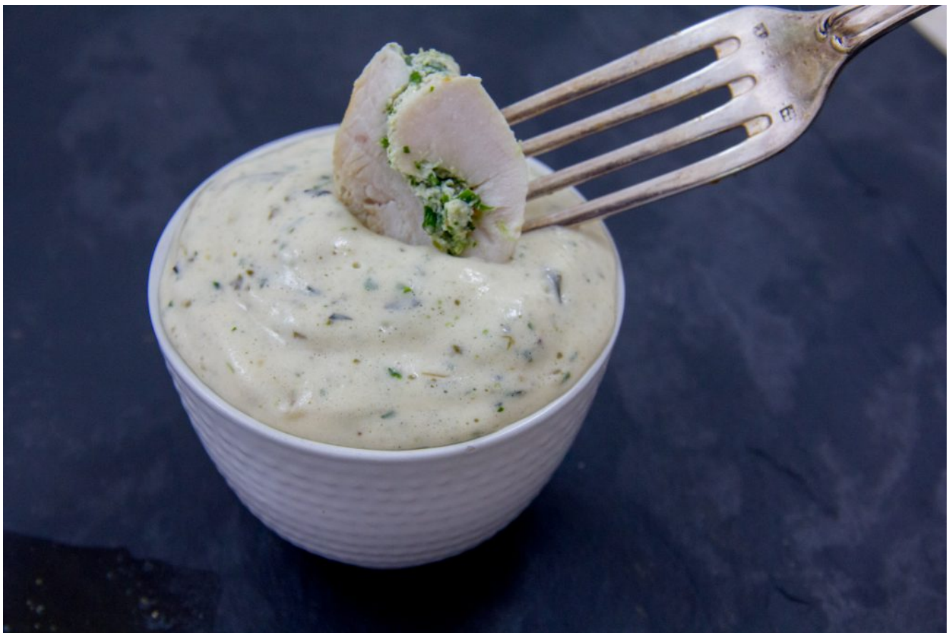
Béarnaise très light et sans beurre