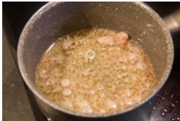
Faites réduire aux 3/4