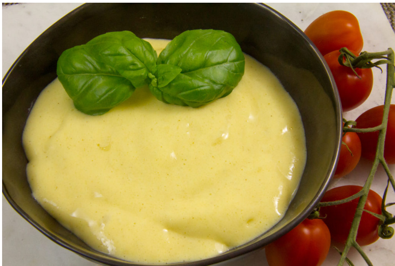
La « mayonnaise » sans huile de Jean François Piège

La « mayonnaise » sans huile de Jean François Piège ou comment se faire plaisir sans manger gras!