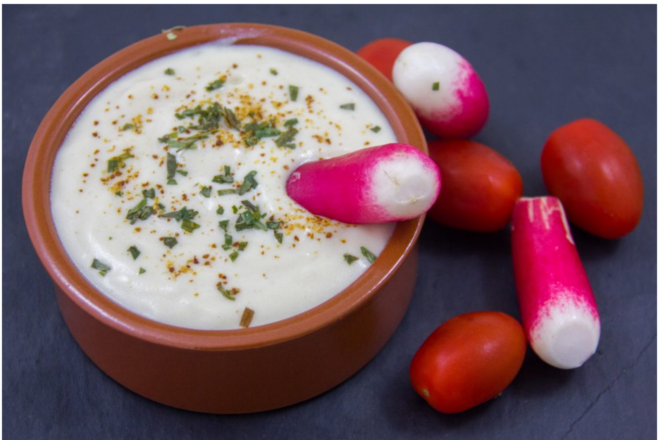
Mayonnaise Vegan sans œufs

Mais je vous ai déniché, comme pour la béarnaise light facile à faire (retrouvez la recette en cliquant ici ) une superbe recette de mayonnaise à base de tofu qui ne nécessite qu'une cuillerée à soupe d'huile. Vous ne pourrez plus jamais la rater tellement sa réalisation est simple et rapide. Légère mais onctueuse comme une vraie mayonnaise vous pourrez bien sûr la parfumer à votre goût avec de la moutarde, du ketchup, du piment d'Espelette, du curry, ou même pour plus d'originalité du fenouil en poudre par exemple. Elle est absolument délicieuse!