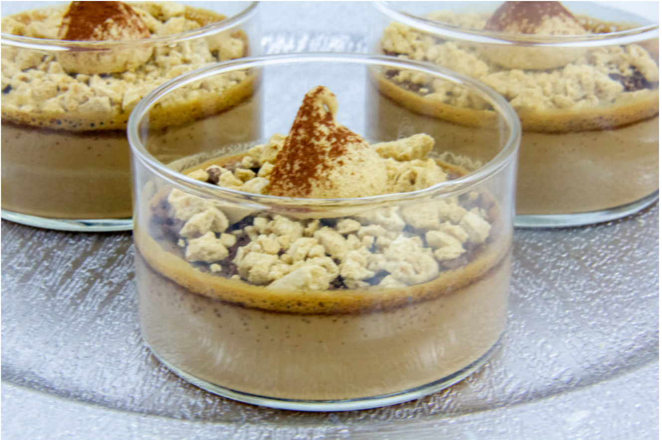
Crème douceur chococafé