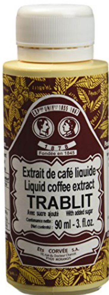
TRABLIT Extrait de Café Liquide 90 ml