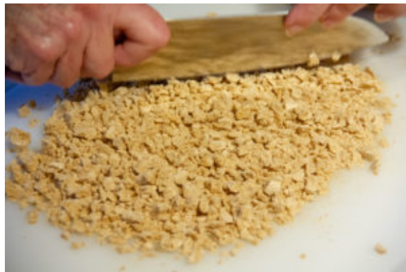
Réalisez de fines brisures avec la meringue