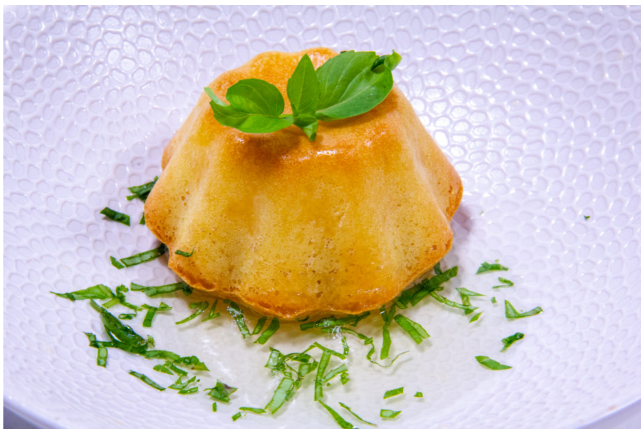
Moelleux au citron, sirop au basilic thaïlandais

Préparez le lemon curd la veille car vous allez devoir le congeler.