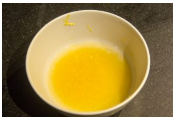
Faites fondre le beurre