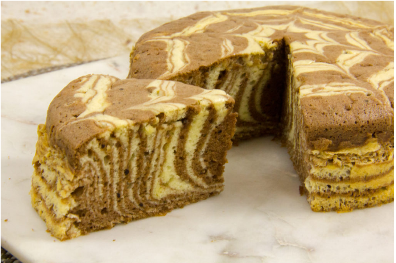
Mon étoile marbré (Épreuve de Cyril Lignac, Le Meilleur pâtissier, les gâteaux marbrés)