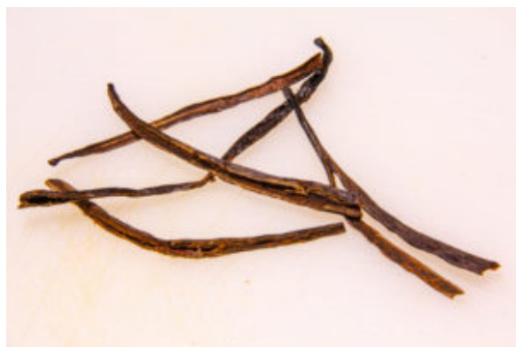
gousses de vanille séchées