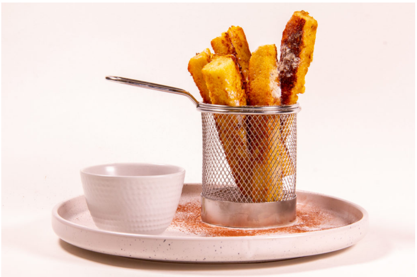
Mon gourmand pain perdu

Facile à faire, avec des ingrédients que nous avons dans nos placards, je l'ai un peu revisité pour vous en proposer une version amusante accompagnée d'un dip au chocolat pour encore plus de gourmandise.