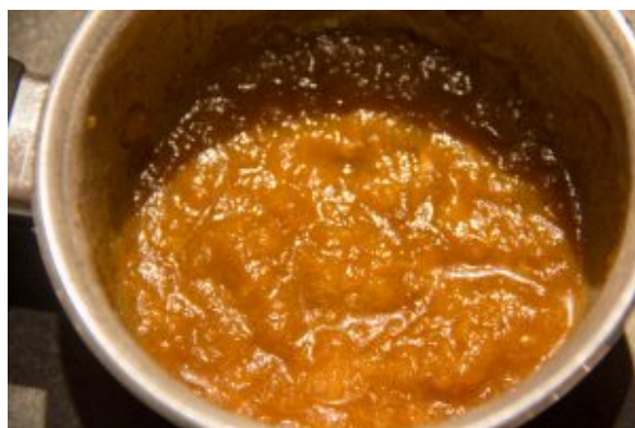
Mixez le chutney d'oignon et