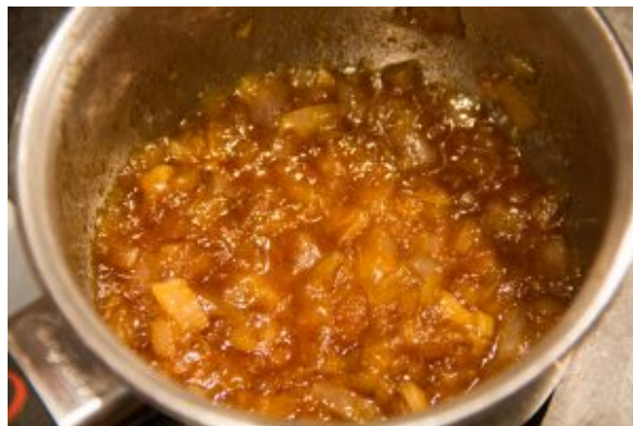
Versez les oignons compotés dans une casserole