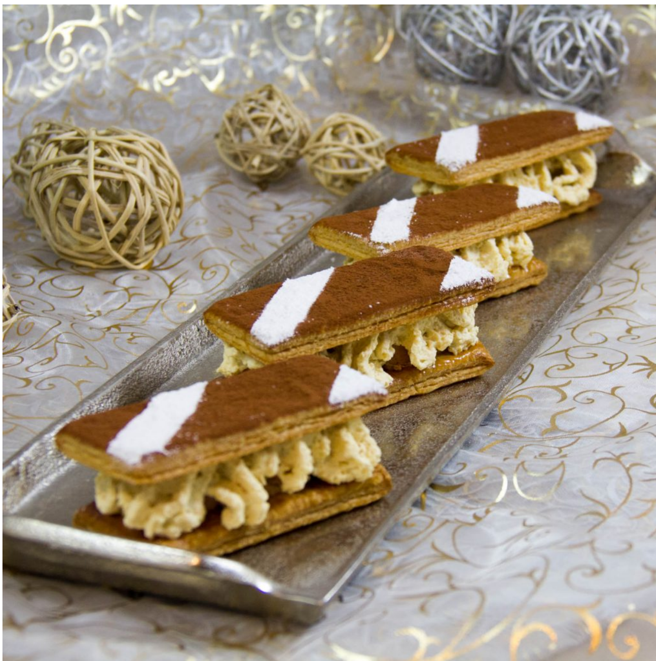
Mon foie gras de Gala

Je vous propose comme promis après la bûche, la troisième recette de mon menu de réveillon. A la fois élégante et gastronomique elle fera grand effet et réglera toute votre maisonnée! Vous pouvez servir cette recette en verrine pour l'apéritif (voir en fin d'article) ou en entrée dans sa version mille feuille.