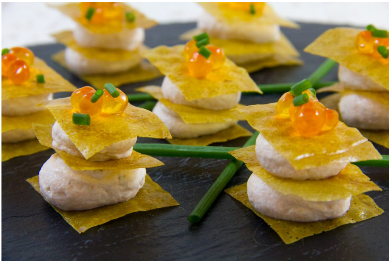
Croquants gourmands au saumon