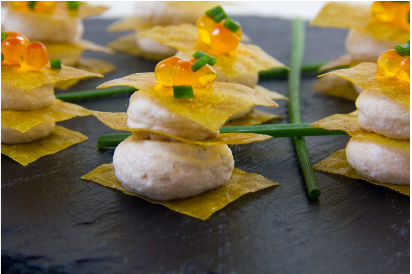
Croquants gourmands de saumon