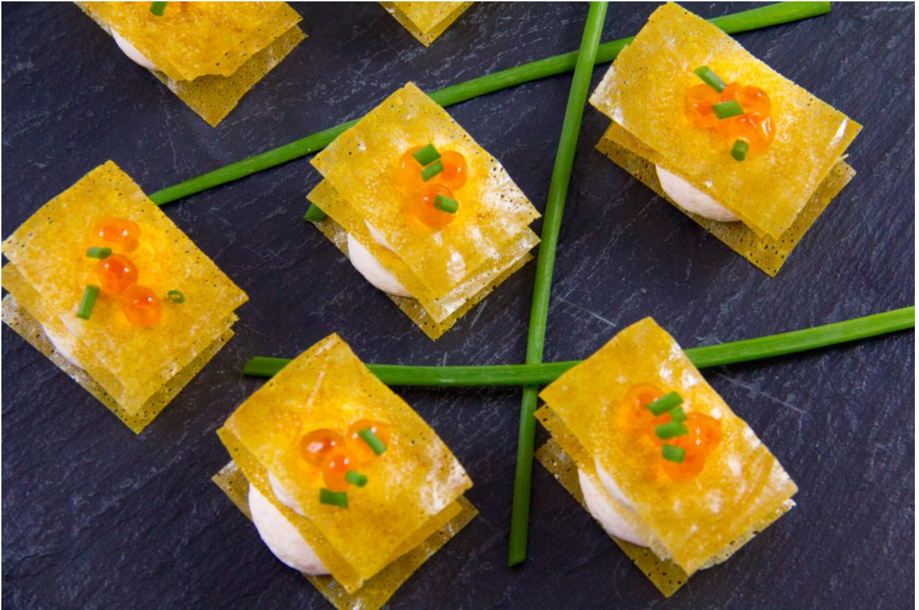
Croquants gourmands de saumon