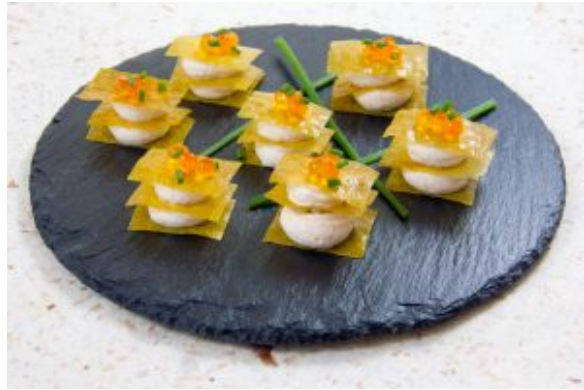
Croquants gourmands de saumon