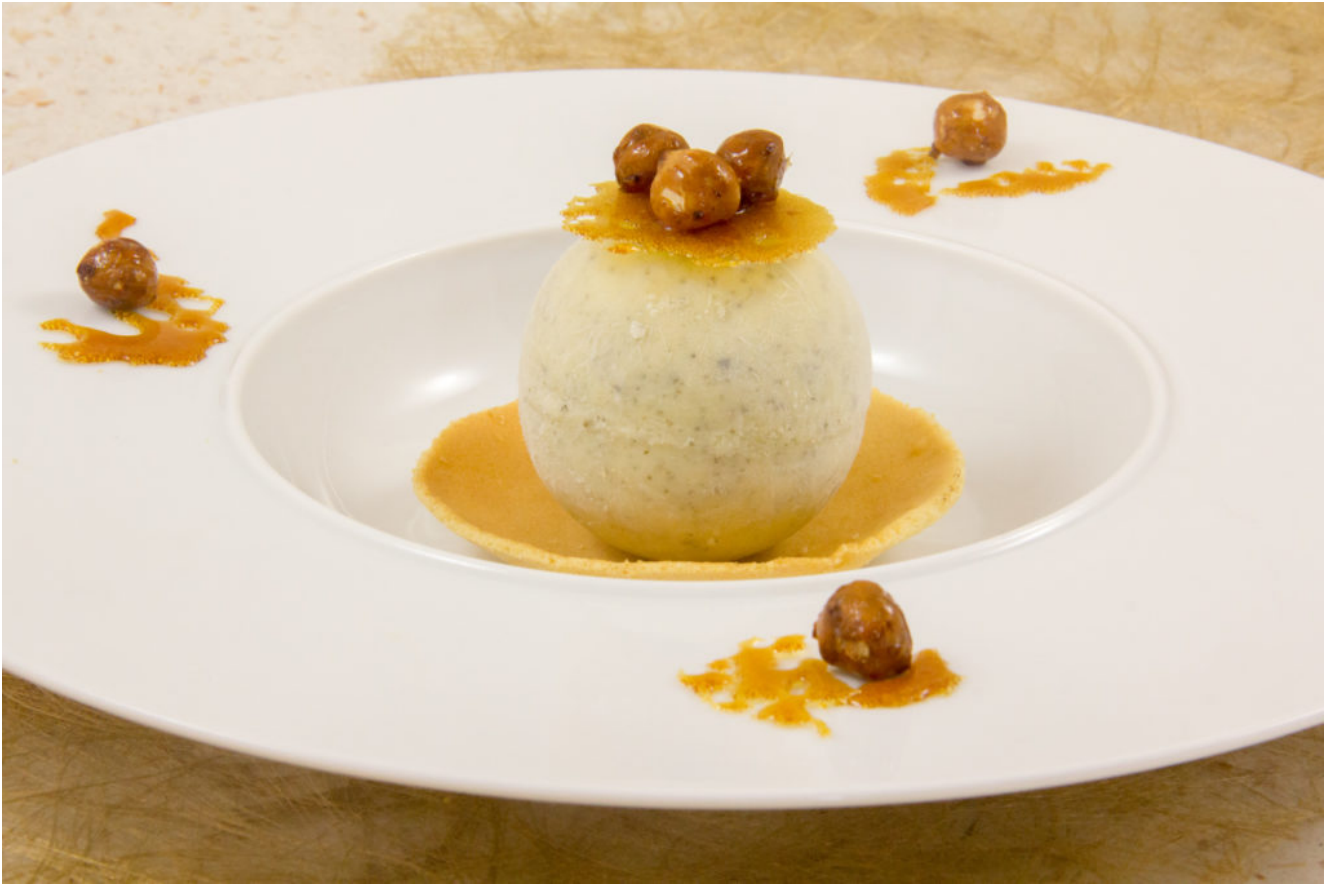
Nid d'abeille (glace miel et romarin)