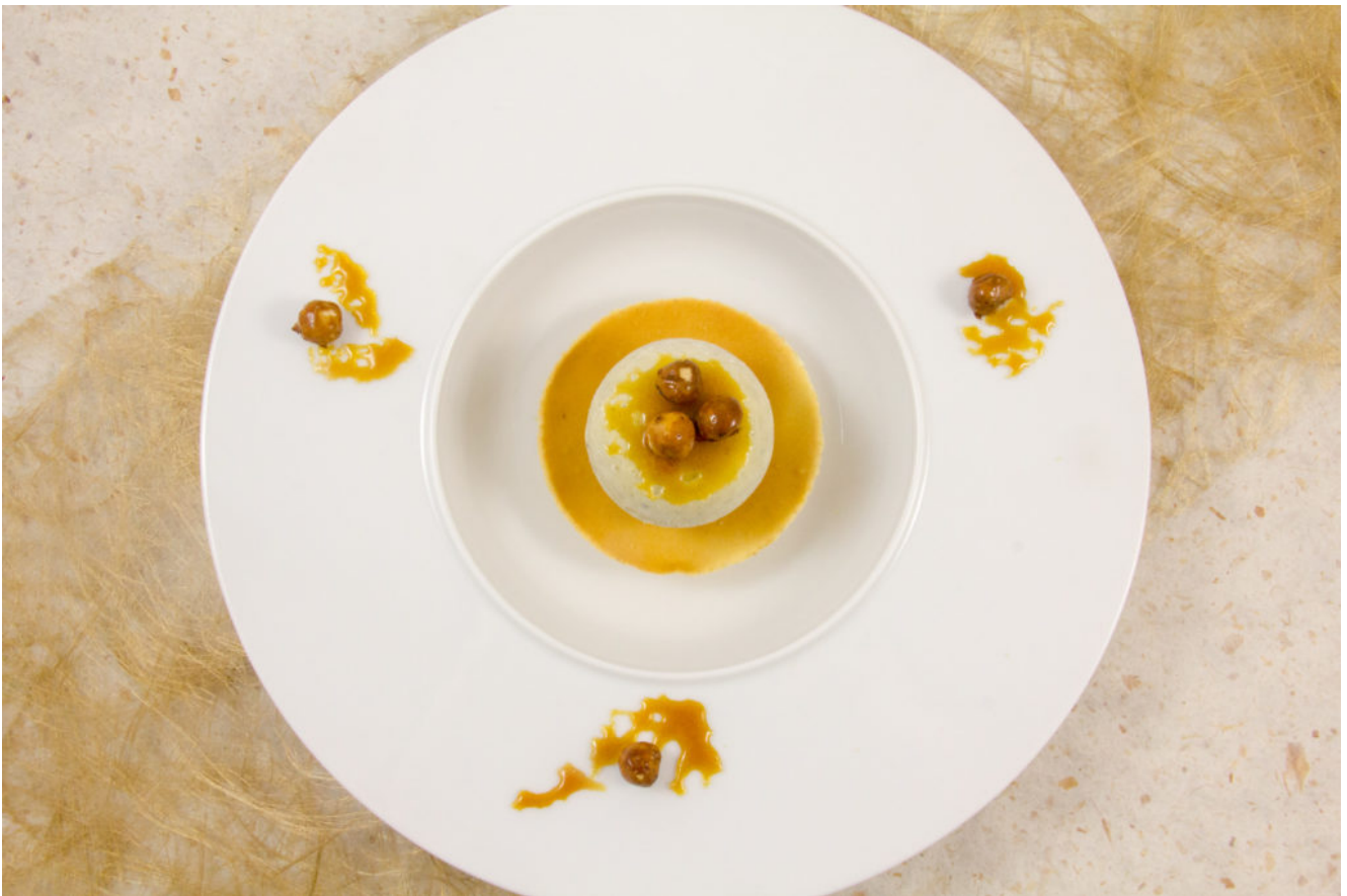
Nid d'abeille (glace miel et romarin)