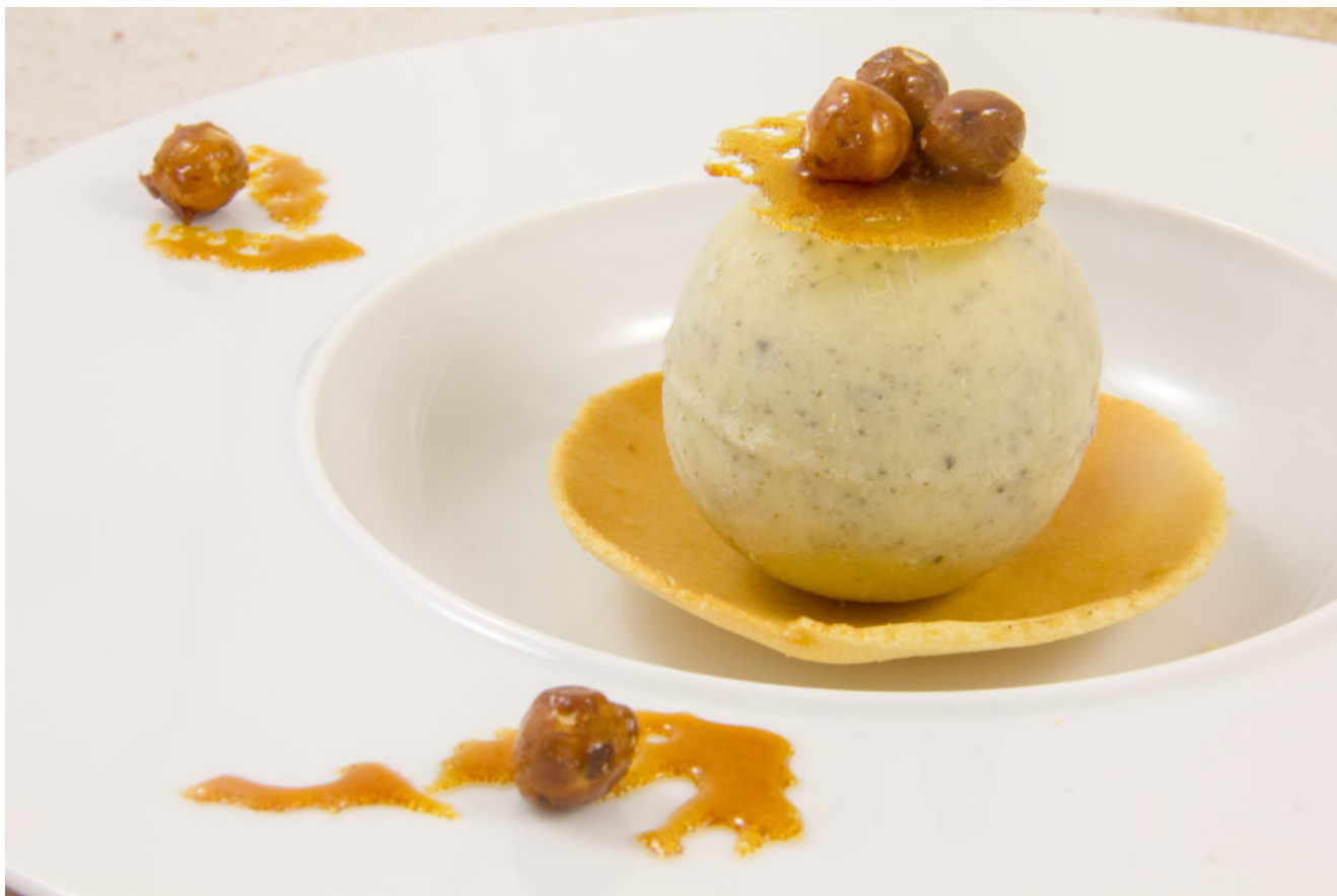
Nid d'abeille (glace miel et romarin)

La vanille et le romarin c'est un mariage ultra gagnant...Je vous propose donc une succulente glace au goût très fin et joliment présentée. Alors régalez-vous!