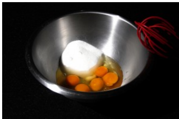
Battre les œufs avec le