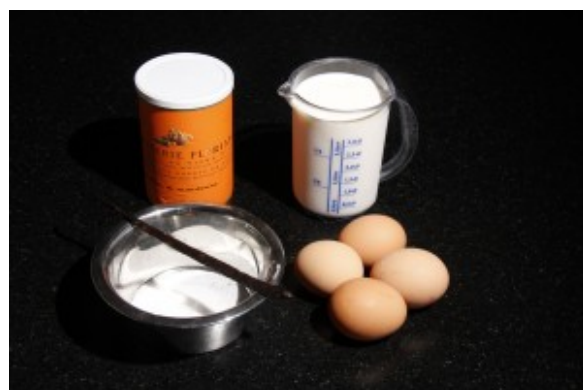
ingrédients pour la crème anglaise