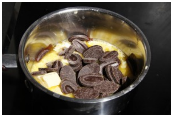
Faire fondre chocolat et beurre