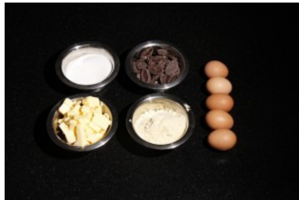
ingrédients pour le gâteau