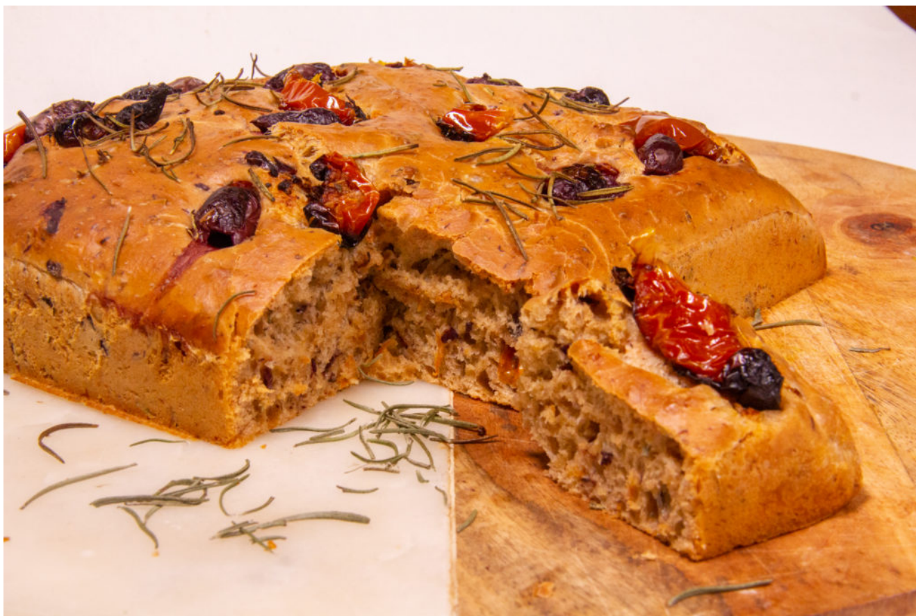
Foccacia tomates, olives et romarin

Pour la recette en vidéo spéciale Thermomix de cette recette voir en fin d'article.