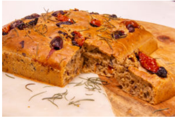
Foccacia tomates, olives et romarin