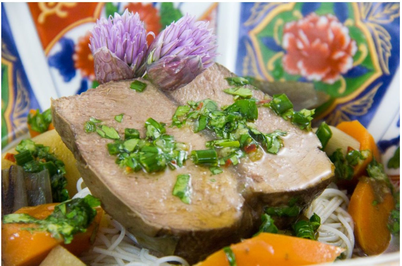
Pot au feu aux arômes thaïlandais, basse température au four