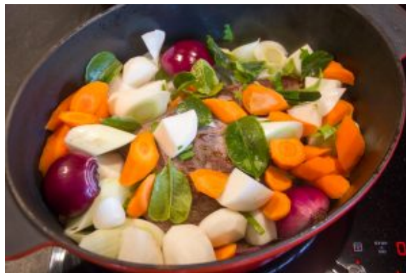
Ajoutez toute la garniture de légumes