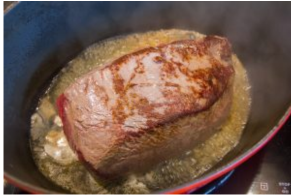
Pot au feu Thaï