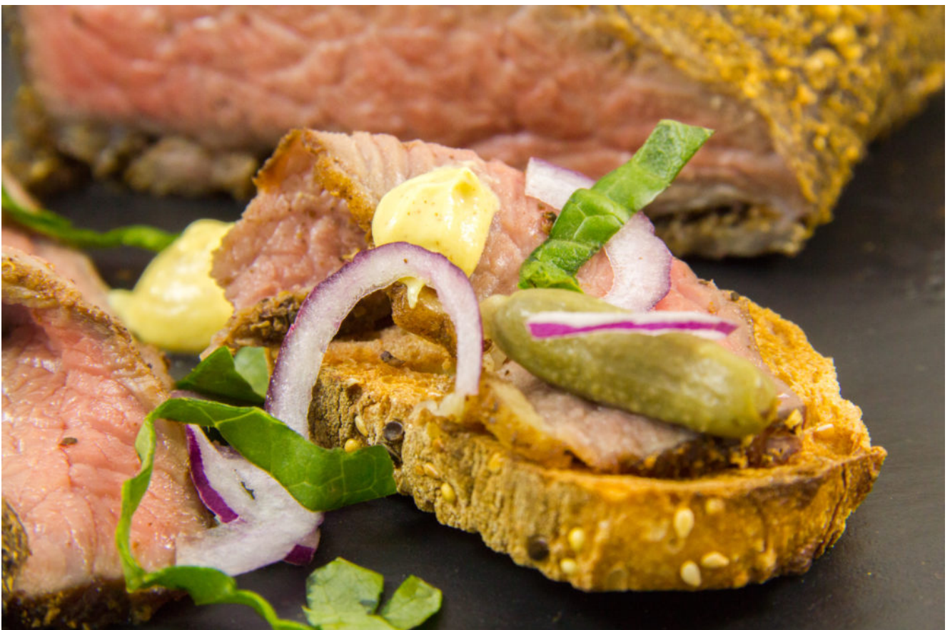
Pastrami basse température (au four)