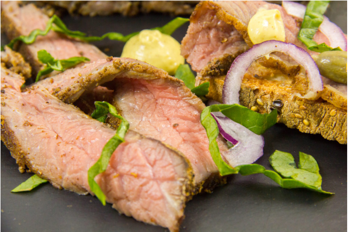
Pastrami basse température (au four)