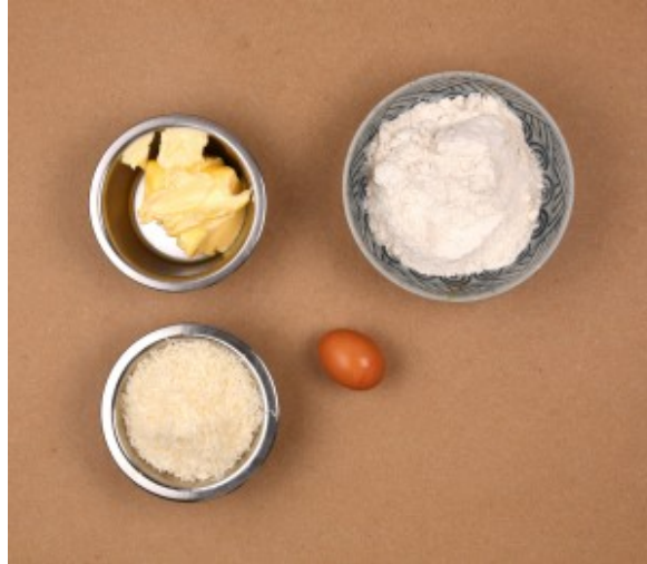
Ingrédients pâte sablée au parmesan