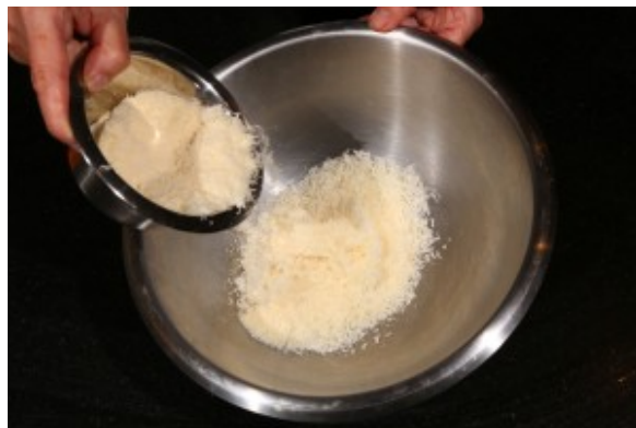
Versez le parmesan dans un grand récipient