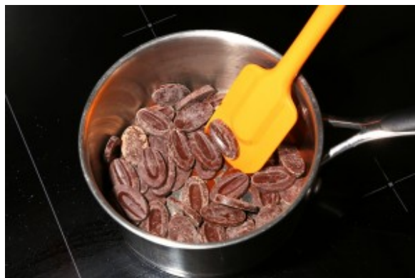
Faire fondre le chocolat