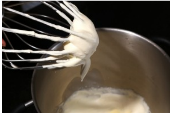
Fouettez la crème en chantilly