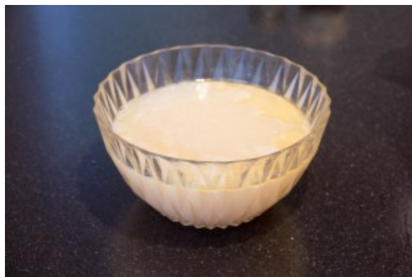
Le fumet est passé