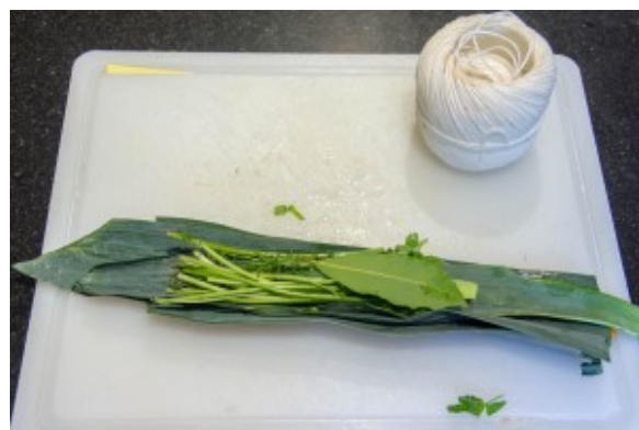
Préparez le bouquet garni