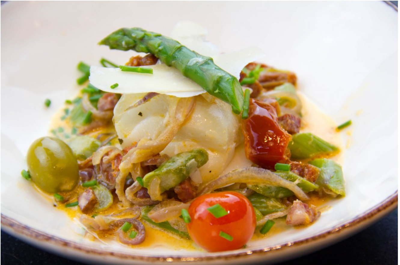
Cabillaud au chorizo, asperges du printemps basse température