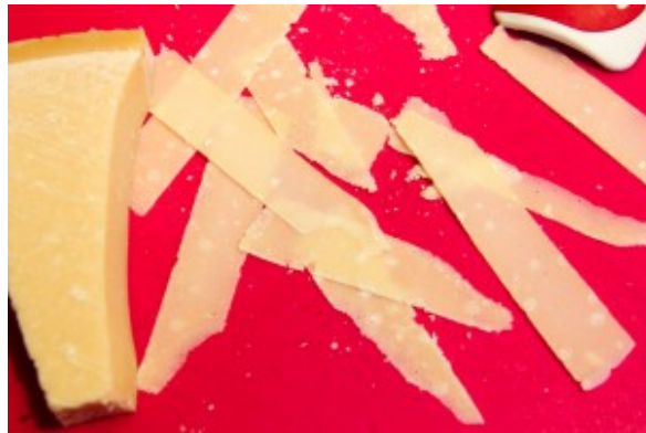
Taillez des copeaux de parmesan