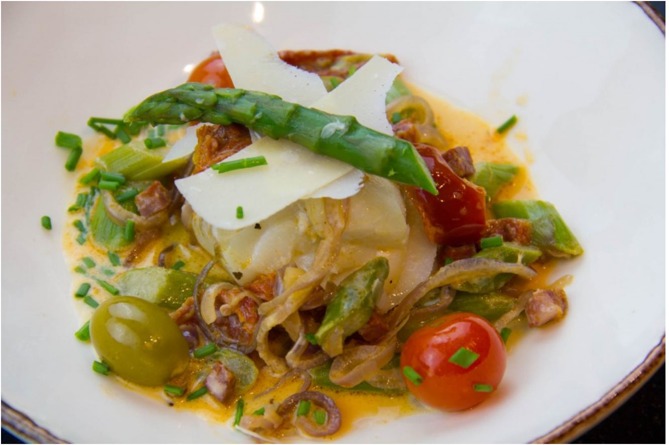
Cabillaud au chorizo, asperges du printemps basse température