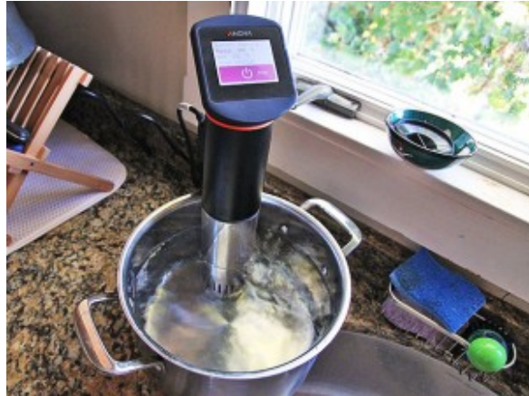
Anova sous vide circulator

hermétiquement dans le film alimentaire. Portez à ébullition un demi litre de fumet puis réduisez le feu de moitié et pochez les boudins pendant 10 mn . Je vous conseille également de préchauffer vos assiettes à 60° au four.