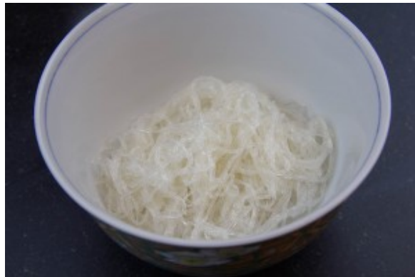
Dressez des nouilles au fond du bol individuel