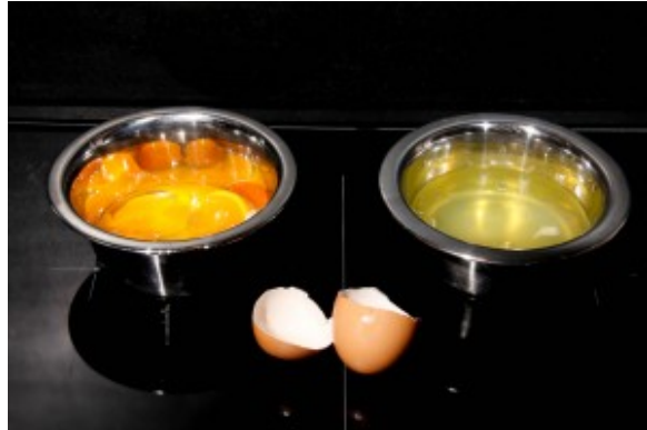
Clarifiez les oeufs