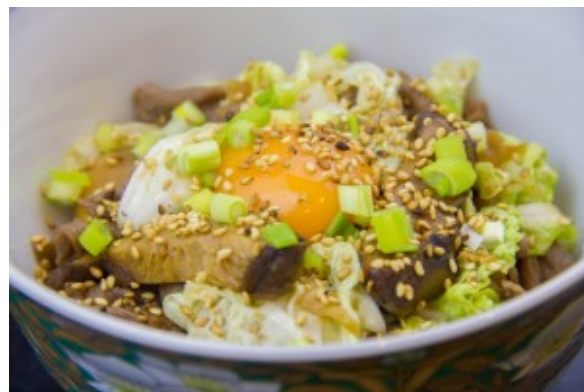
Mon Sukiyaki revisité ( fondue japonaise au bœuf, nouille et légumes)

Je vous le propose ici revisité en plats individuels. C'est un plat qui remporte toujours énormément de succès à la maison! Pour vous procurer les ingrédients japonais qui vous manquent voici l'adresse d'un site de vente en ligne: Kioko ( seulement en France).