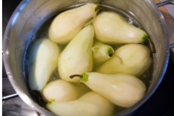
Pochez les poires dans le sirop