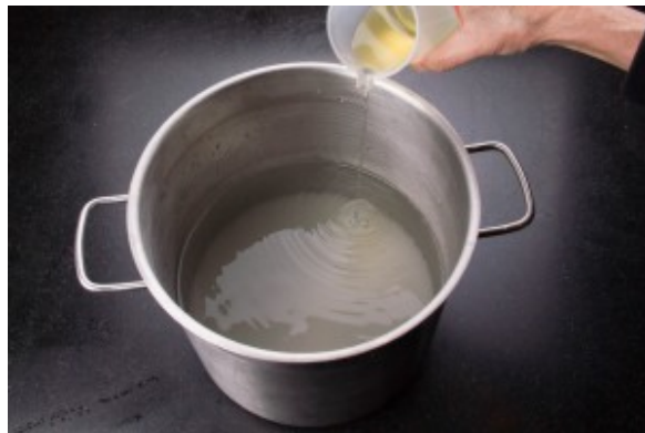
Ajoutez le pastis