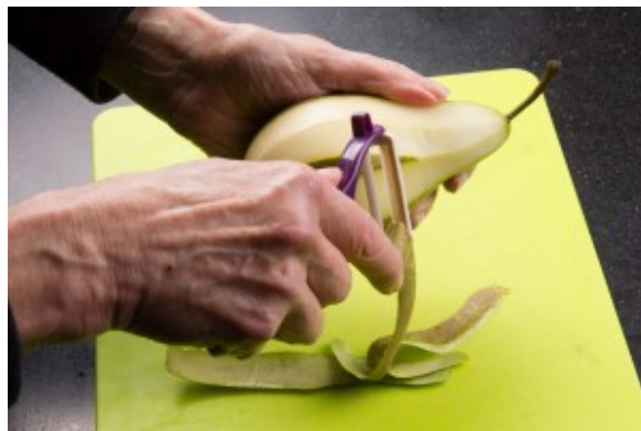
Pelez les poires