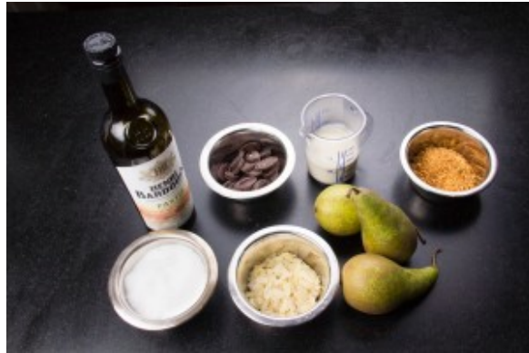
Ingrédients de la poire au chocolat