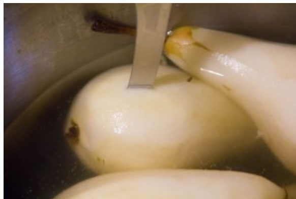
Vérifiez la cuisson des poires