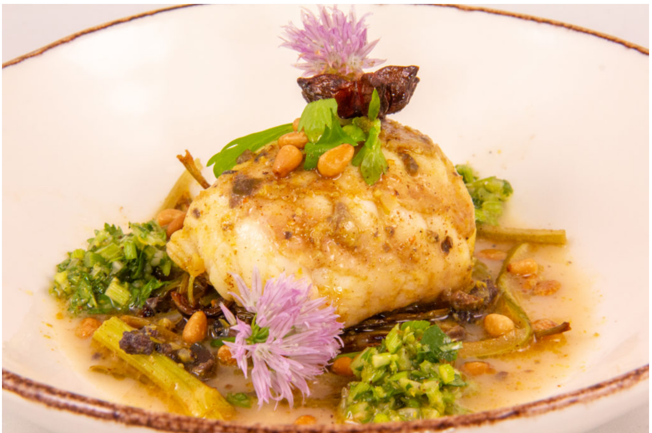
Lotte mariné Basse température et sa déclinaison de céleri

Une nouvelle recette basse température à base d'un poisson que j'aime beaucoup: la lotte. La cuisson basse température lui convient particulièrement bien car sa chair a tendance à devenir dure à la cuisson si on ne la maîtrise pas... Pas de souci avec la basse température: vous aurez une lotte délicieusement tendre! Elle est accompagnée de céleri branche que l'on ne cuisine pas souvent et c'est bien dommage car cru comme cuit il amène une touche herbacée très fraîche et croquante.